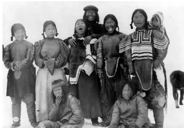
Neuf inuits posent pour un photographe en 1913.

Si vous souhaitez réagir à cette chronique, un forum est ouvert à la suite du même article publié sur Ouaubreton