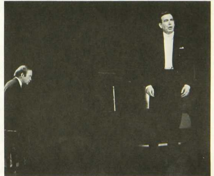
Dalton Baldwin et Gérard Souzay