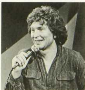
Magazine animé par Winston McQuade. Chronique du lundi: les arts visuels, avec Jean-Louis Robillard; les disques, avec Benoît L'Herbier. Dir. mus.: François Cousineau. Séquences filmées: Louis Arpin. Coord.: Jacques Demers. Réal.: Jacques Payette.