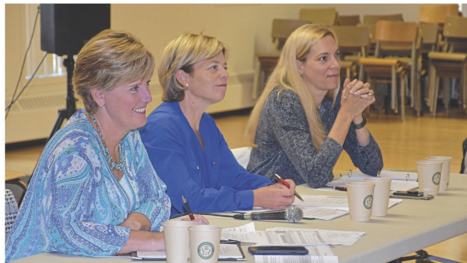
Les députées-ministres Marie-Claude Bibeau (Compton-Stanstead) et Pascale St-Onge (Brome-Missisquoi) entourent la députée de Sherbrooke, Élisabeth Brière.

« Nous avons eu l'occasion de discuter des sujets qui préoccupent réellement les maires et mairesses de chez nous, de réfléchir ensemble à des solutions concrètes et d'évaluer les façons dont le gouvernement fédéral peut mieux les soutenir », ajoute la secrétaire parlementaire et députée de Sherbrooke, Élisabeth Brière.