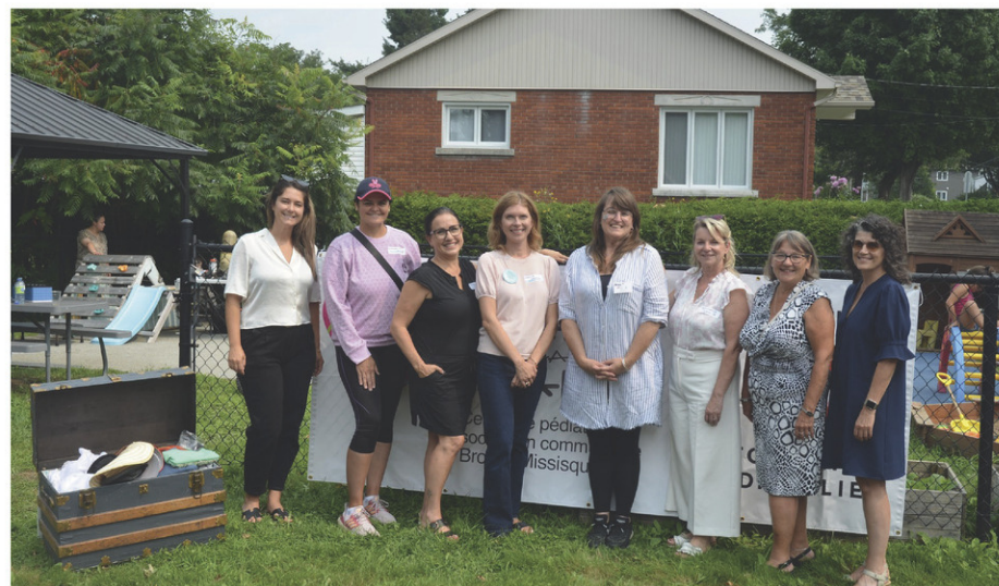
C'est dans une ambiance festive que se tenait la fête de la rentrée de Main dans la main, le 15 août dernier. Des dignitaires se sont déplacés pour l'occasion.

« J'ai toujours aimé redonner, c'est pour ça que je vais en soins infirmiers, explique-t-elle. Les gens de Main dans la main m'ont tellement donné et continuent encore à le faire, même si