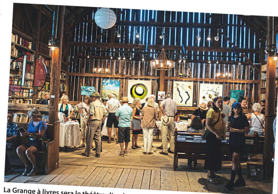
La Grange à livres sera le théâtre d'un lancement de livre, d'un club de lecture, d'une table ronde sur le roman policier, d'une animation jeunesse et de séances de dédicace le samedi de la fête du Travail.