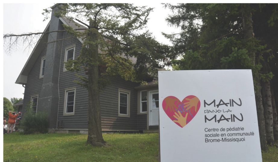
Main dans la main est maintenant installé sur la rue du Sud, à l'intersection des rues Miner et Draper, à Cowansville.

j'approche des 18 ans. C'est tellement plaisant d'interagir avec le monde. »