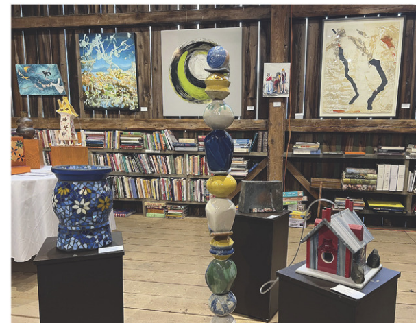
Le lancement du Boulevard des arts s'est tenu au vignoble Clos de l'Orme blanc à Saint-Armand.