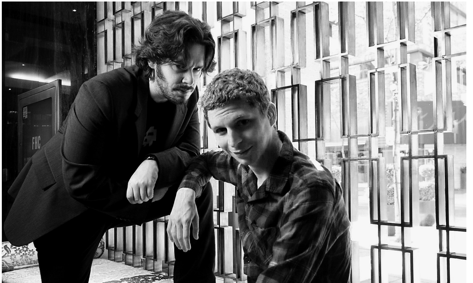
Le réalisateur Edgar Wright a adapté au cinéma la série de comic books Scott Pilgrim vs. the World . Michael Cera tient le rôle-titre.

Six ans plus tard, Scott est le héros de six bandes dessinées et d'un film pétillant, coloré et jouissif, Scott Pilgrim vs. the World , signé Edgar Wright, qui sort aujourd'hui en DVD et en Blu-ray – «avec 17 heures de suppléments que nous avons produits. Ceux qui ont aimé le long métrage vont s'éclater», dit, au bout du fil, le réalisateur britannique à qui l'on doit aussi Shaun of the Dead et Hot Fuzz , de passage à Toronto.