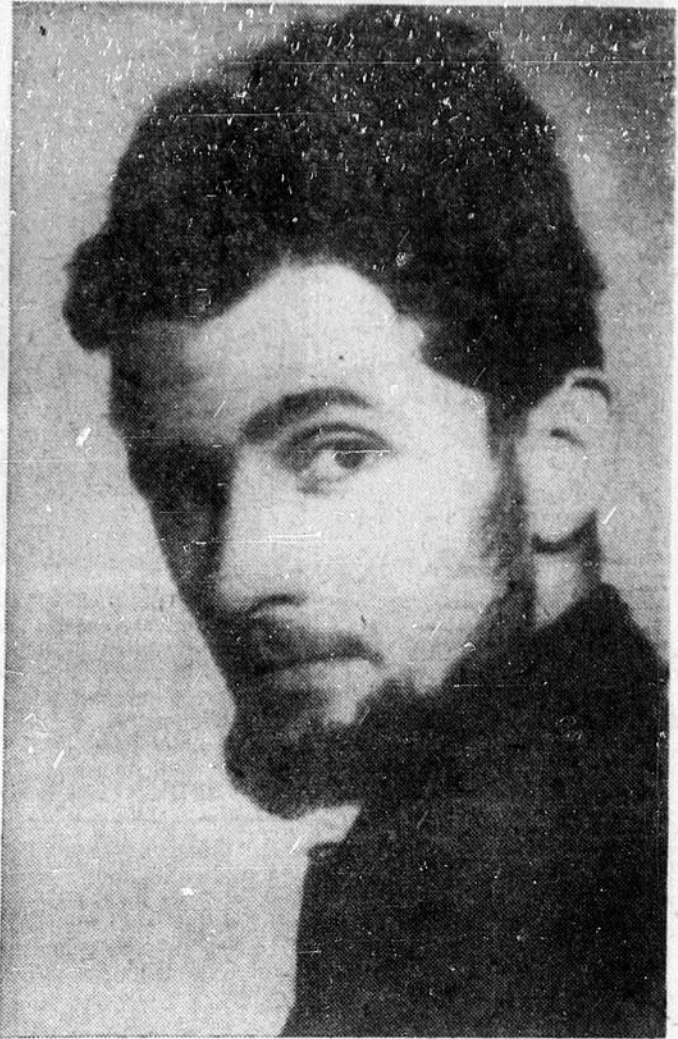
JOHN REEVES, jeune dramaturge, poète et réalisateur au réseau anglais de la radio, est l'auteur de "A Beach of Strangers", oeuvre qui a mérité, cette année, le prix international Italia à la Société Radio-Canada. Ce prix, qui est de $3,750, a été présenté à M. Reeves par les 23 nations membres de l'Assemblée générale du prix Italia.