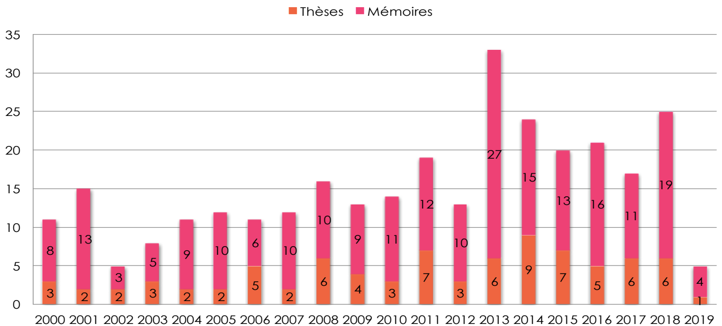
Figure 2 : Type de travaux par université québécoise 4