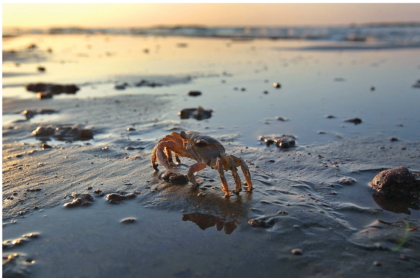
Un crabe englué de pétrole sur une plage à Grand Isle, en Louisiane. Selon une analyse de l'Associated Press, la pétrolière BP, qui est à l'origine de la marée noire du golfe du Mexique, serait tirée d'affaire.

Si Dominique Strauss-Kahn devait se lancer dans la course à la présidentielle, les termes de son contrat de travail lui imposeraient une démission immédiate de son poste de directeur général du Fonds monétaire international.