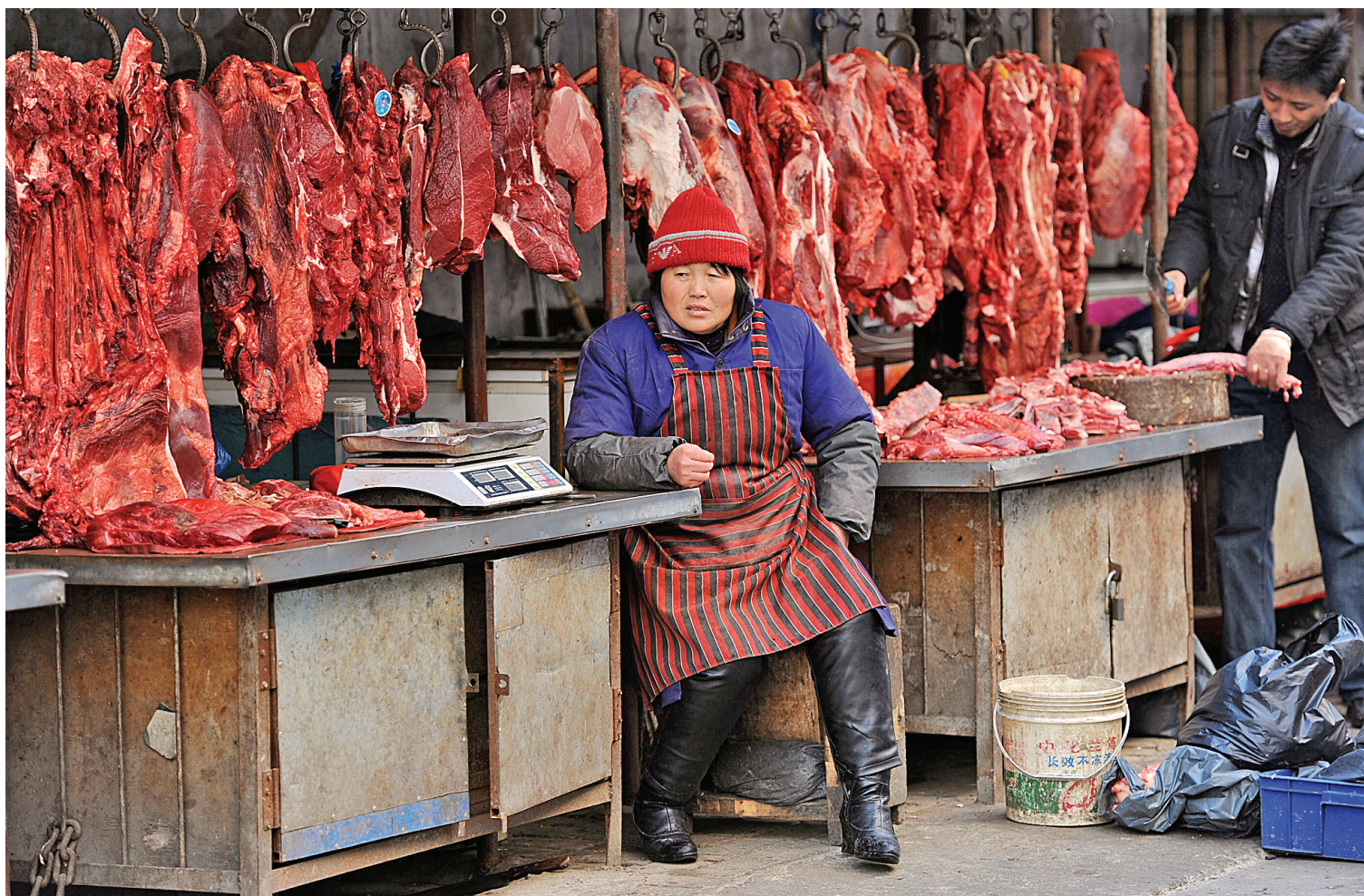
Une marchande attend les clients dans le marché de Hefei, dans l'est de la Chine.