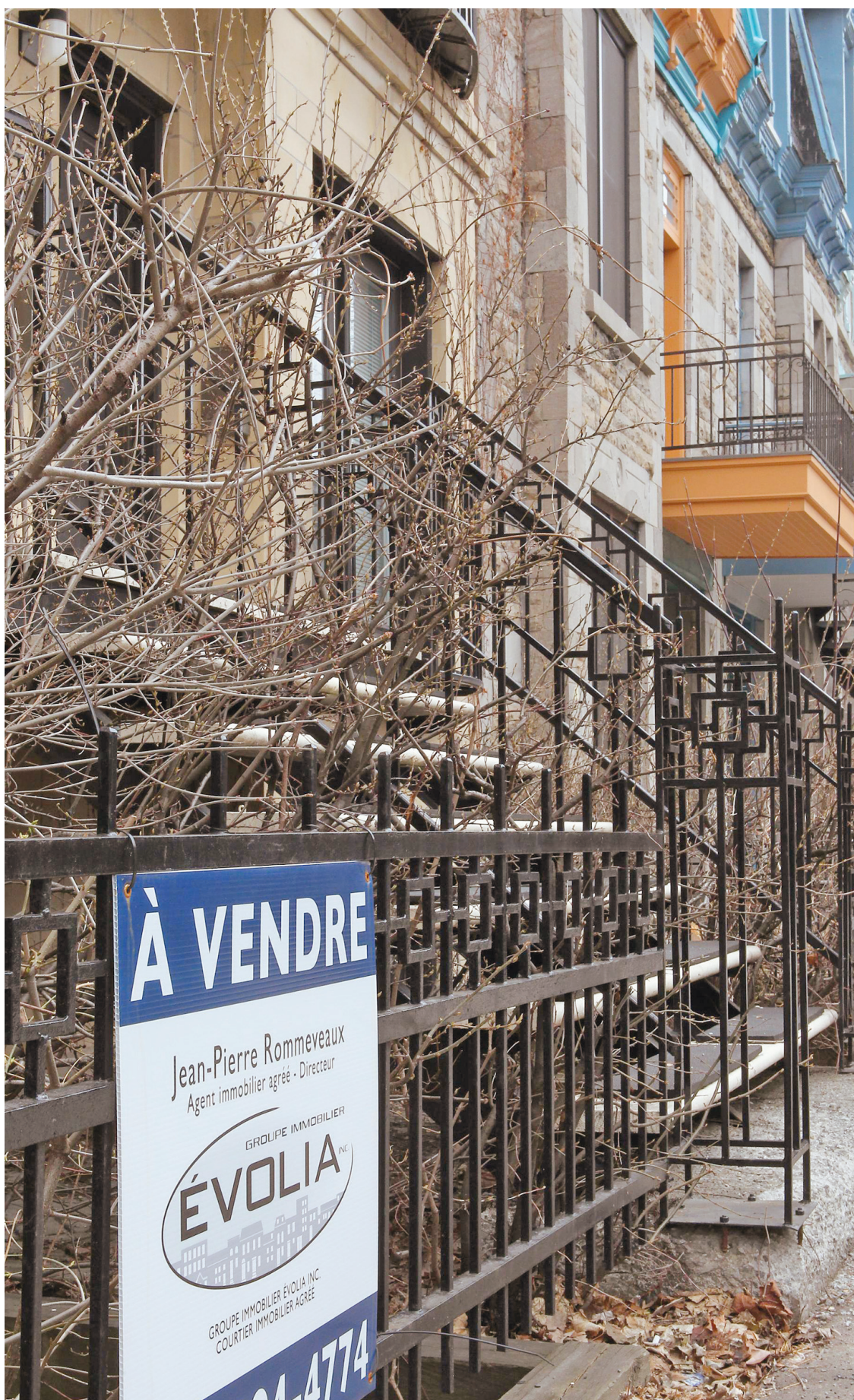
L'Association canadienne de l'immeuble projette une baisse des ventes de 4,9 % cette année et de 9 % l'an prochain.

Cette poussée des prix, insoutenable, et le sérieux virage