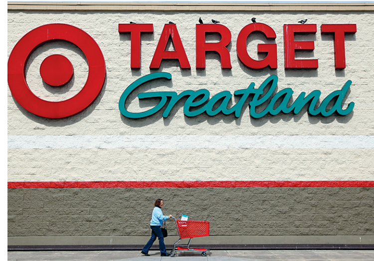
Target a le Canada dans son viseur. La chaîne de Minneapolis est le détaillant de marchandise à prix réduit le plus important aux États-Unis après Wal-Mart.