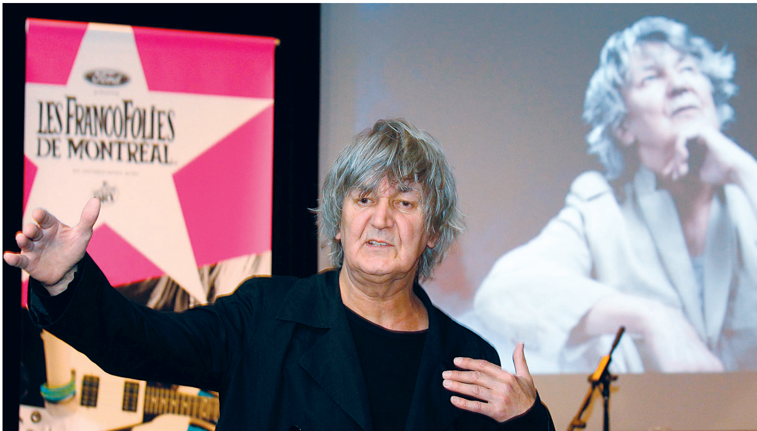
Jacques Higelin lors de son passage aux FrancoFolies, l'été dernier à Montréal.

Les cinq meilleurs spectacles francos de 2010