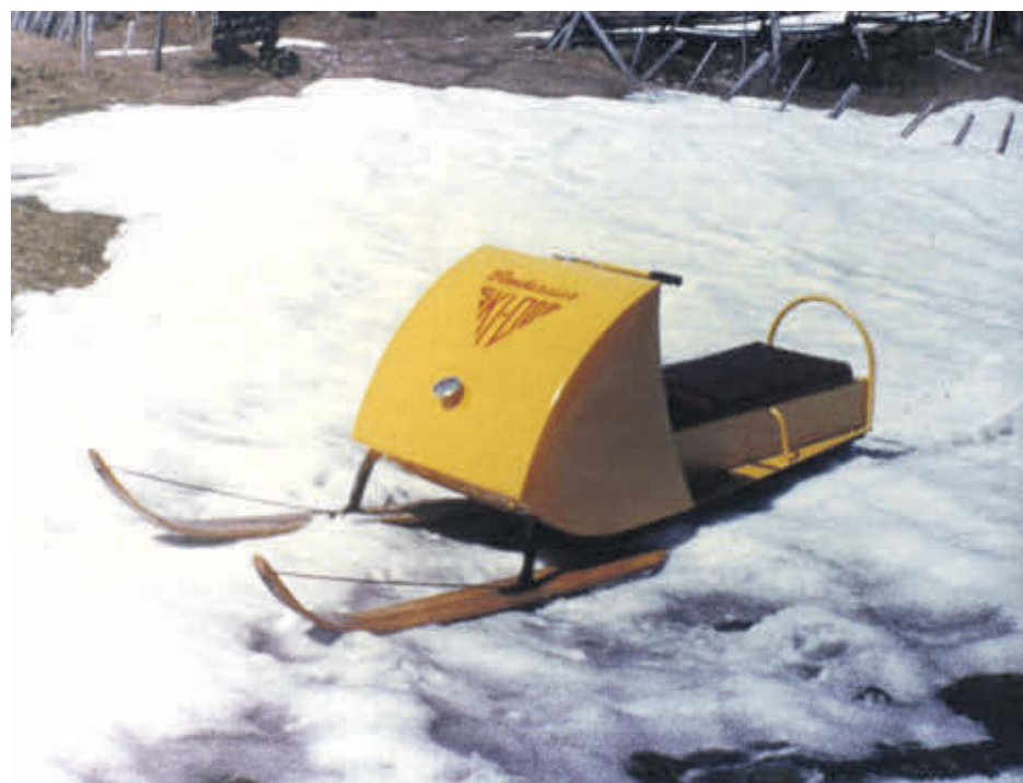
Le Ski-Doo, un engin pouvant transporter une ou deux personnes et à prix abordable, a été commercialisé par Joseph-Armand Bombardier en 1959.