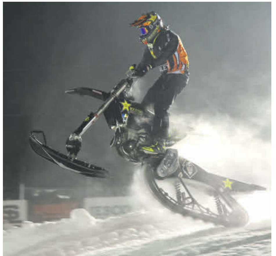
Avec la pandémie qui continue de faire d'importants ravages à cause du variant Omicron, le Grand Prix Ski-Doo de Valcourt devra attendre à l'an prochain avant de célébrer sa 40 e édition.

« Nous avons la chance de compter sur des partenaires et commanditaires très compréhensifs. Et au cours de l'année, nous serons très présents sur les médias sociaux, avec entre autres du contenu relié à notre 40 e anniversaire. On lancera également un livre commémoratif. Nous vous promettons un retour en force l'an prochain, dans une ambiance très festive! », conclut le directeur général du GPSV.