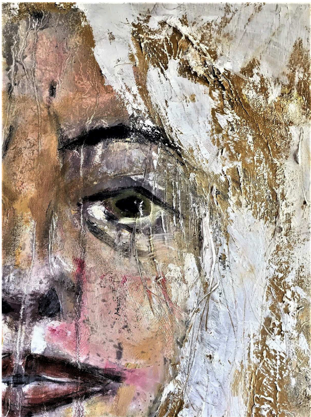
2018. Huile sur toile, 120 x 80 cm.