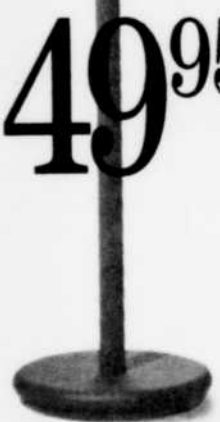
ILMENTI. Torchère halogène. Régulateur d'intensité. Coloris assortis. 49,95 $ ch.