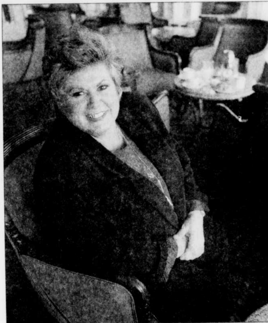
Le nouveau disque de Ginette Reno, les confessions d'une chanteuse du siècle.