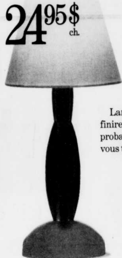
DESS. Lampe de table. Pied en acrylique. Abat-jour revêtu coton. 24,95 $ ch.