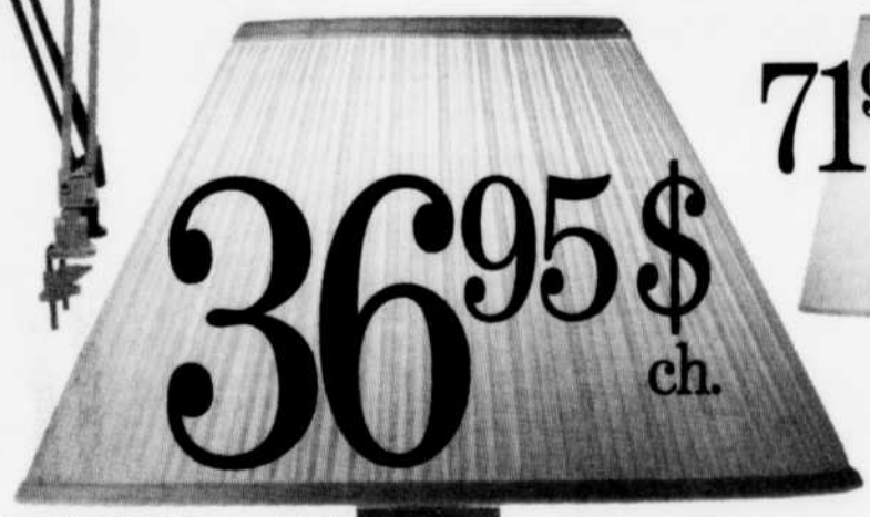
AUGIT/LYNNE. Lampe de table. Pied en bois. Abat-jour plissé en tissu. 36,95 $ ch.