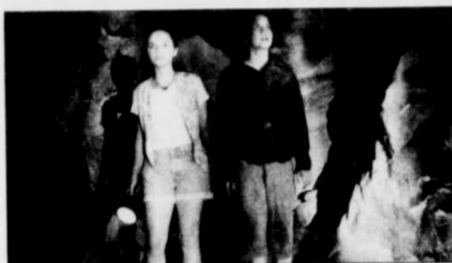
Beth (Christina Ricci) à gauche, et Jody (Anna Chlumsky) se retrouvent plongées dans une chasse aux trésors.

plique à Macaulay Culkin. Dans Le secret de Bear Mountain , elles incarnent Beth et Jody, des pré-adolescentes qui se lient d'amitié et qui vont partager ensemble une chasse aux trésors, dans une montagne qui aurait abrité autrefois une mine d'or. C'est Jody, une «tomboy» qui n'a peur