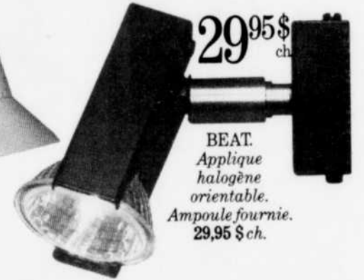
BEAT. Applique halogène orientable. Ampoule fournie. 29,95 $ ch.