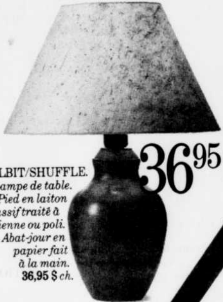
ALBIT/SHUFFLE. Lampe de table. Pied en laiton massif traité à l'ancienne ou poli. Abat-jour en papier fait à la main. 36,95 $ ch.