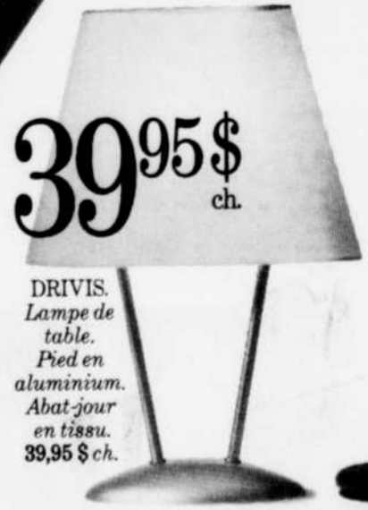
DRIVIS. Lampe de table. Pied en aluminium. Abat-jour en tissu. 39,95 $ ch.