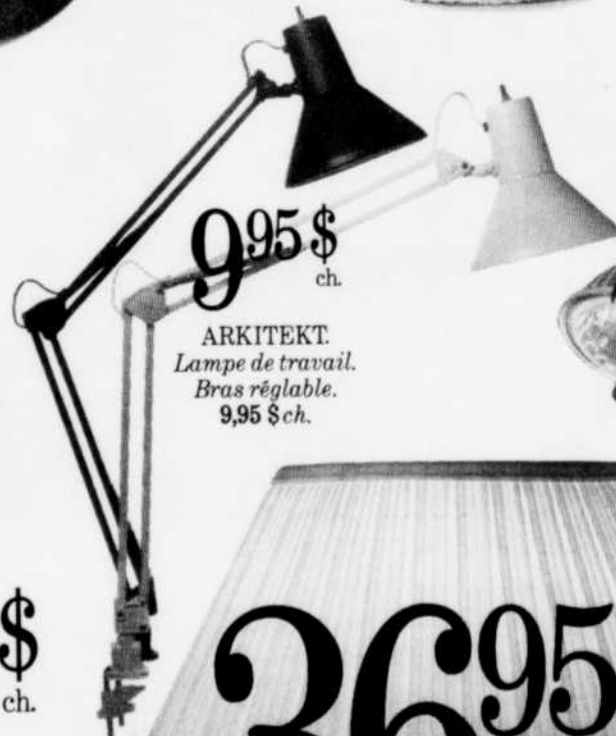
ARKITEKT. Lampe de travail. Bras réglable. 9,95 $ ch.