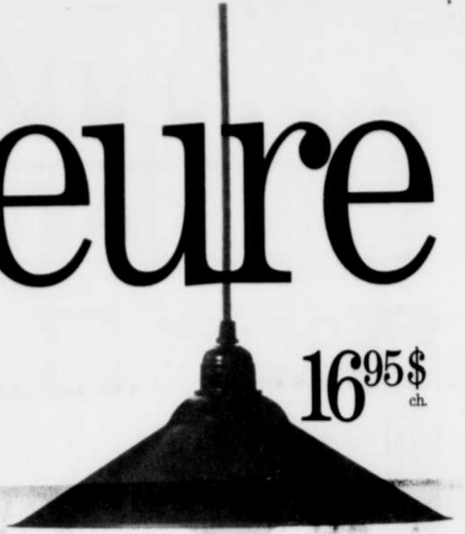
LYRA. Suspension. Abat-jour en aluminium laqué. 16,95 $ ch.

Lampes pratiques, lampes décoratives, appliques, suspensions, vous finirez par ne plus supporter le noir. En fait, votre seule limite sera probablement le nombre de prises dont vous disposez. Quoique, chez IKEA, vous trouverez aussi des rallonges et autres accessoires.