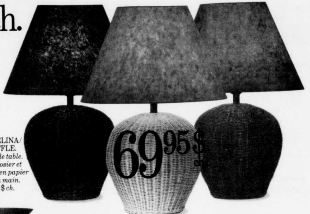
KANTELINA/SHUFFLE. Lampe de table. Pied en osier et abat-jour en papier fait à la main. 69,95 $ ch.