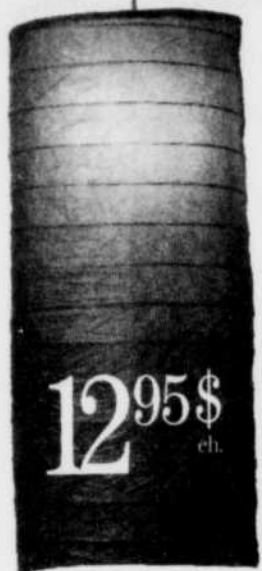
RISLAMPA. Abat-jour en papier de riz non-blanchi. Ovale, cylindrique ou rectangulaire. 12,95 $ ch.