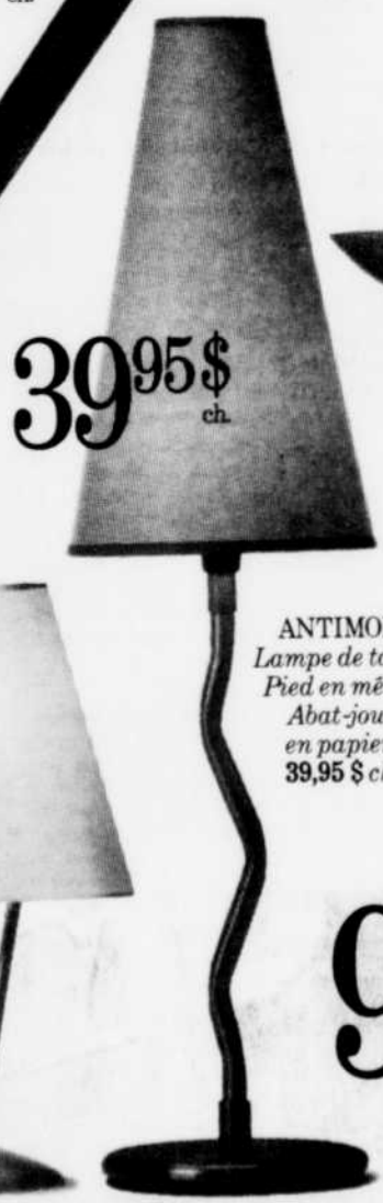
ANTIMON. Lampe de table. Pied en métal. Abat-jour en papier. 39,95 $ ch.