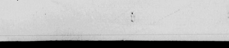
Le soldat Gaston MONDOUX, 154, rue Guigues, était parmi le groupe de rapatriés arrivés à la gare Union, tard samedi soir, après un séjour outre-mer. Le soldat Mondoux fut accueilli à la gare par Mlle Fautoux, 45 1/2, rue Water, et Mme Cousineau, 16, rue Water, des amies de la famille Mondoux.