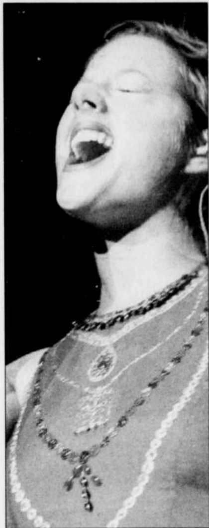
Sarah McLachlan, la grande prêtresse du festival Lilith Fair