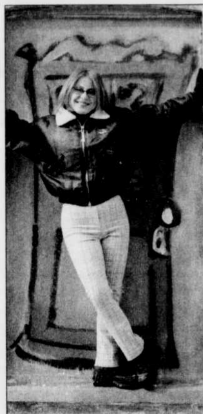
LE SOLEIL ARCHIVES Nancy Dumais