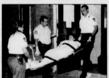
Les ambulanciers ont transporté la mère dans un hôpital.

Le lieutenant Pierre Voisard avouait qu'il avait rarement eu affaire à un événement de ce genre. « C'est assez spécial. C'est comme si on revenait en arrière quand les gens donnaient naissance dans leurs maisons, mais on est