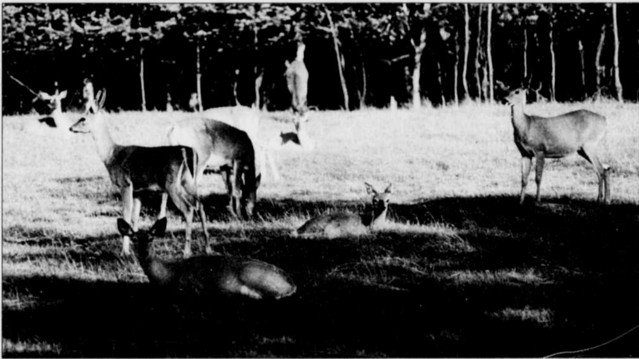
COLLABORATION SPÉCIALE, ROMAIN PELLETIER

Année après année, la Seigneurie du chevreuil accueille quelque 10 000 visiteurs de la mi-mai à la mi-octobre à Saint-Jérôme-de-Matane, le long de la route Matane/Amqui. Il s'agit d'une attraction unique en Gaspésie, si ce n'est au Québec, soutiennent ses propriétaires Lauriane et Renaud Gauthier. Depuis près de dix ans, ils ont reçu la visite d'au moins 100 000 personnes provenant d'un peu partout dans le monde. Les visiteurs peuvent voir de très près plus de 200 bêtes élevées dans leur milieu naturel. Ces dernières sont retenues par une clôture de cinq kilomètres qui les protègent des prédateurs. Plusieurs sont apprivoisées et bon nombre se laissent approcher ou viennent d'elles-mêmes sentir ou chercher de la nourriture. La Seigneurie du chevreuil est ouverte à tous les jours de 8 h à 20 h et les Gauthier se font un plaisir de répondre à toutes les questions. R. P.