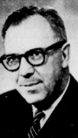
Me Jules ST-PIERRE, juge de la Cour provinciale et affecté au district judiciaire de Montréal.

ST ROMAIN — Co. FRONTENAC — TEL: 486-2429 Sherbrooke — 562-2809 — Thetford Mines: 338-4343