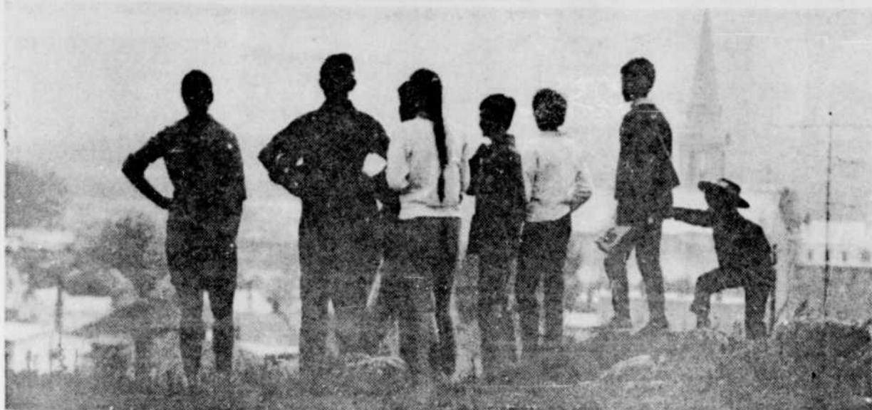
"THETFORD HIER ET AUJOURD'HUI" — Une grande exposition de photographies se tiendra à Thetford Mines du 25 au 29 septembre, sous l'égide de M. Jacques Fugère, photographe professionnel. La photo reproduite ci-dessus est le reflet du thème de l'exposition: "Thetford hier et aujourd'hui".