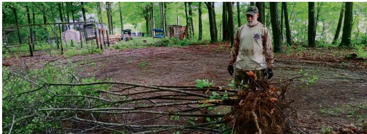
Une corvée d'arrachage de nerprun bourdaine s'est déroulée dans une érablière à Sainte-Christine, le 28 mai.