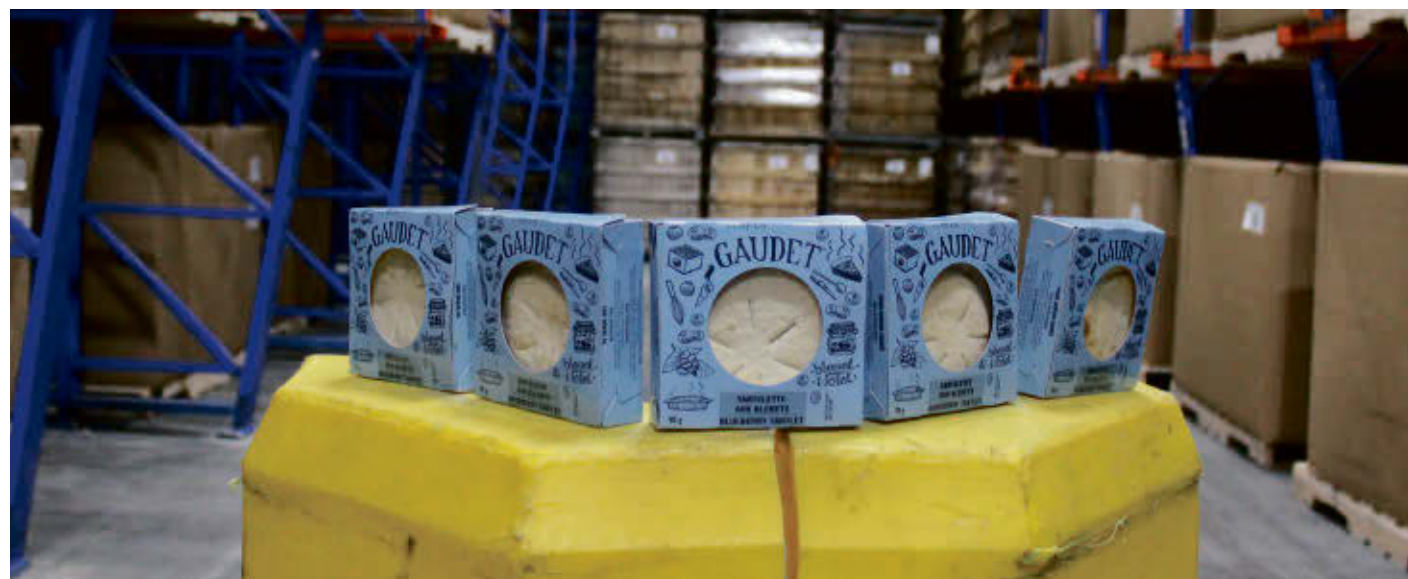
Près de 100 000 tartelettes sont toujours entreposées chez Transport et Entreposage JSMG à Acton Vale.

L'idée de se départir des milliers de tartelettes qui encombrant le local de l'entreprise valoise a grandement intéressé les organismes locaux et les banques alimentaires. Passant de la Moisson maskoutaine à la Moisson Mauricie, plusieurs organisations sont venues remplir leurs paniers de desserts afin de les distribuer à leur tour aux gens dans le besoin. Bien que généreux, ce geste permettra de libérer de l'espace dans l'entrepôt de JSMG. « Ça fait quatre mois que je suis pris avec les tartelettes à cause de la faillite de Pâtisserie Gaudet. Au lieu de les jeter et avec l'accord du syndic, j'ai fait appel aux Moissons du coin pour qu'ils prennent ce dont ils ont besoin. Ça fait mon affaire,