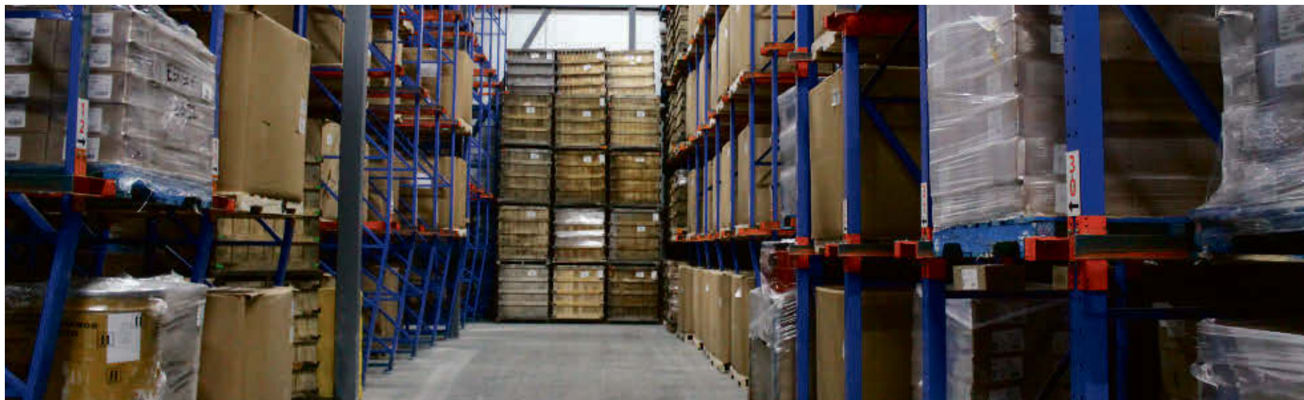
Des sacs de fruits congelés et des barils de garnitures à tartelettes garnissent toujours l'entrepôt de 18 000 pi 2 .

Rappelons que Transport et Entreposage JSMG fait partie des 210 créanciers non garantis qui ont été victimes de la faillite de 32 M$ de Pâtisserie Gaudet l'été dernier.