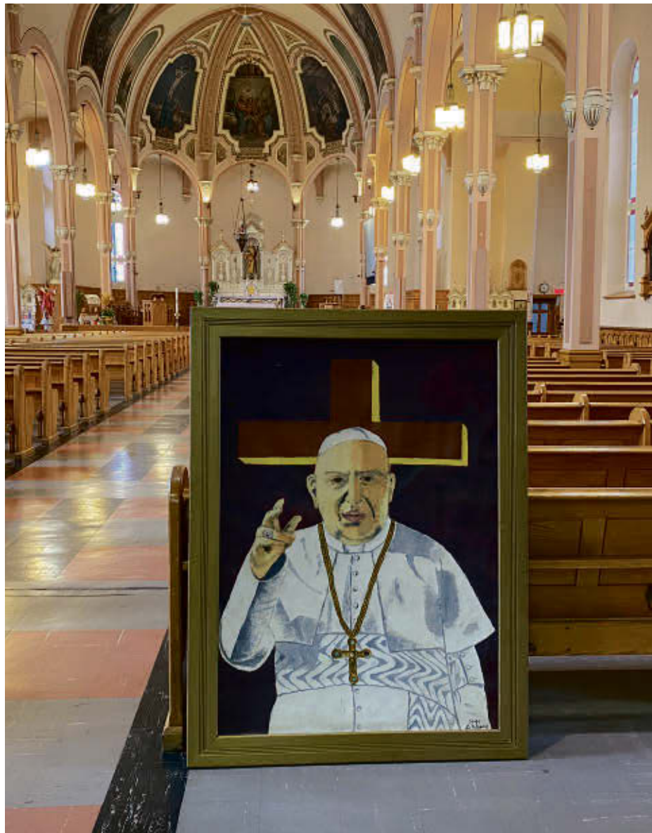
L'œuvre Jean XXIII de Serge Lemoyne est exposée à l'église Saint-André d'Acton Vale.