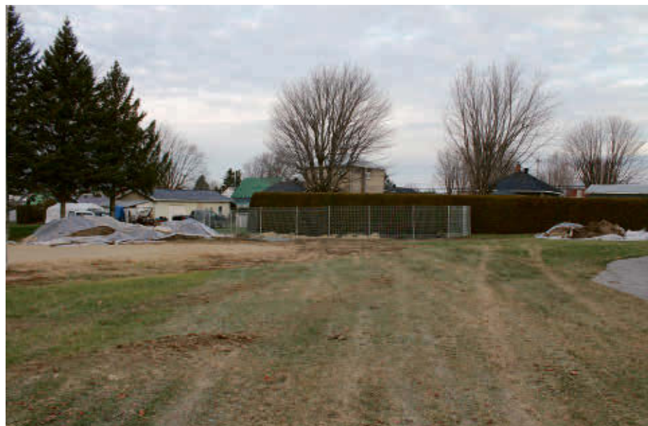
Des travailleurs ont procédé à des tests de sols le 2 décembre sur le futur site du CPE de Saint-Théodore-d'Acton.

Le bâtiment sera construit sur un bout du terrain des loisirs de la Municipalité cédé par le biais d'un bail emphytéotique qui est d'une durée de 40 ans. Un tel type de bail est conditionnel à un engagement de procéder à des constructions ou à des améliorations augmentant la valeur de la propriété. Celles-ci appartiendront au bailleur au terme du bail.