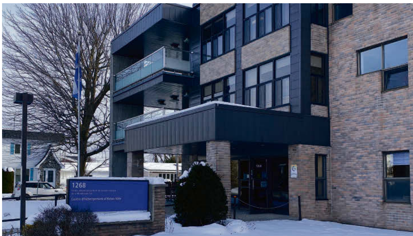
Le rez-de-chaussée du Centre d'hébergement de la MRC-d'Acton est temporairement fermé à la communauté depuis le mois de juillet par manque de personnel.

Au moment d'écrire ces lignes, le CISSS de la Montérégie-Est n'a pu confirmer le nombre d'employés manquants sur le plancher permettant de rouvrir l'étage toujours non accessible.