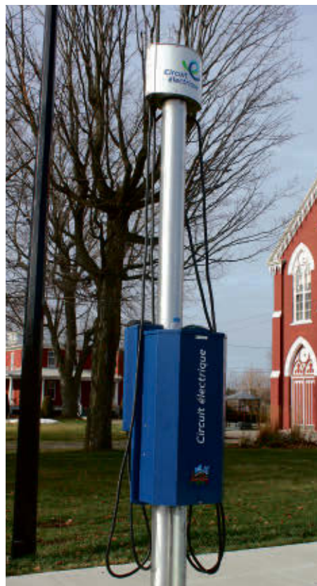
La borne de recharge pour les véhicules électriques est désormais disponible aux usagers.

En mai 2021, Hydro-Québec avait annoncé qu'elle s'appropriait à déployer 4500 bornes standards d'ici 2028 pour répondre aux besoins des conducteurs de véhicules électriques qui n'ont pas accès à la recharge à domicile. Cela faisait suite à l'annonce du ministère de l'Environnement du Québec en novembre 2020 indiquant que la vente de véhicules neufs à essence serait interdite au Québec dès 2035.