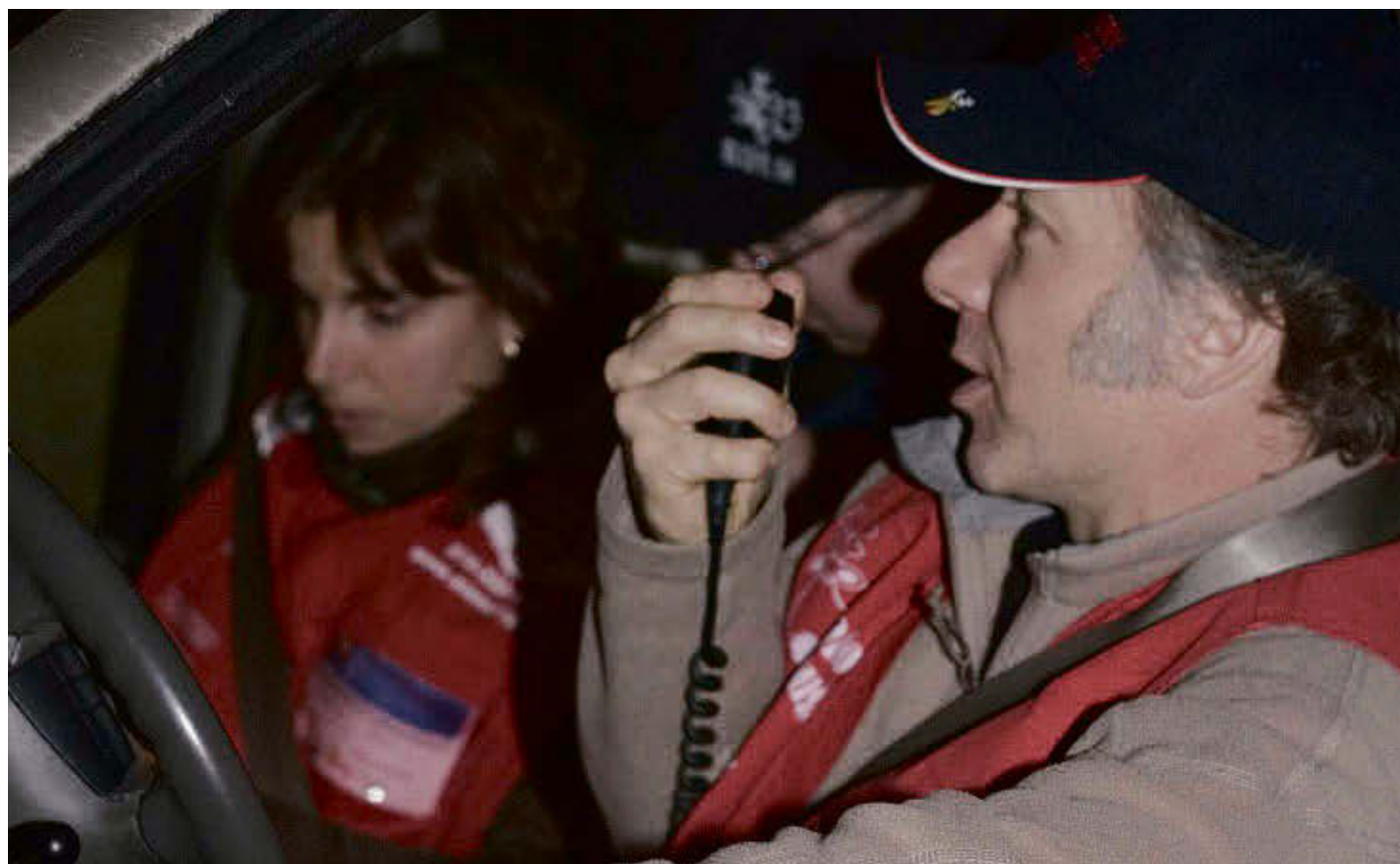
Le service de raccompagnement Nez rouge est temporairement hors-service depuis 2020 à Acton Vale.

Du côté de Drummondville, où certains des résidents d'Acton Vale et des environs travaillent, la Fondation du Cégep de Drummondville a renoncé à être le maître d'œuvre d'Opération Nez rouge, notamment en raison d'un manque d'espace dans ses installations.