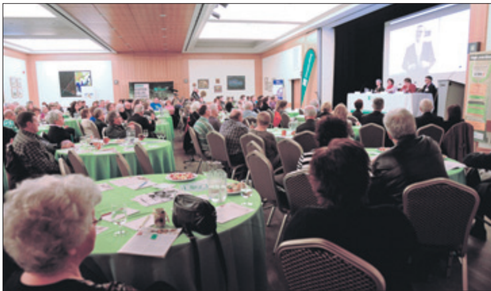
Les membres ont assisté en très grand nombre à l'assemblée générale annuelle de la Caisse populaire Desjardins de Saint-Augustin-de-Desmaures.