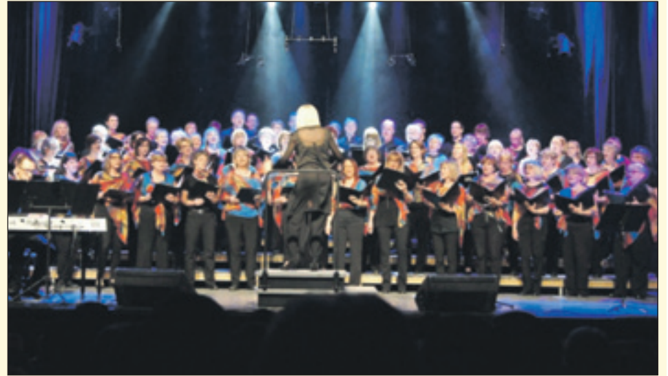
Le Groupe Vocal La-Mi-Sol de Saint-Augustin-de-Desmaures vous offrira son spectacle annuel, « Chante la vie » le samedi 28 mai prochain à 20h00 à la salle Desjardins du Centre Jean-Marie-Roy, 4950 rue Lionel-Groulx.

Il vous est possible d'acheter des billets à la billetterie électronique du groupe vocal à l'adresse suivante : billetterie@groupevocallamisol.org au coût de 25 $ par adulte et 5 $ par enfant (12 ans et moins). ■