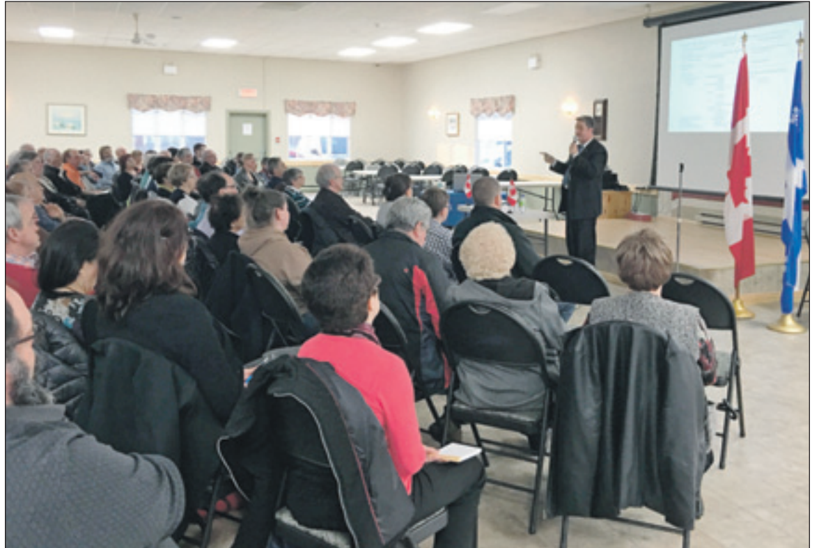
Joël Godin, député de Portneuf-Jacques-Cartier, est fier du succès des soirées-conférences organisées pour les organismes, qui ont eu lieu les 26 et 27 avril derniers.

« J'ai eu l'occasion de présenter les services que j'offre à mon bureau de circonscription et j'ai senti un réel intérêt des gens présents à en apprendre davantage. Mon équipe et moi sommes là pour eux et c'est le message que je souhaitais partager. J'ai également sensibilisé les gens sur le travail que j'effectue lorsque je siège à la Chambre des communes. De nombreuses décisions cruciales touchant la vie des Canadiens se prennent chaque jour au Parlement et il est de mon devoir de partager cette information avec les citoyens de Portneuf-Jacques-Cartier », a conclu Joël Godin. ■