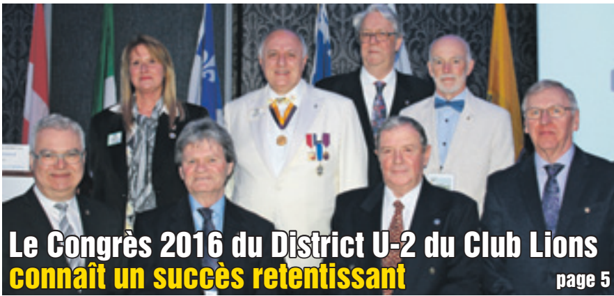
Le Congrès 2016 du District U-2 du Club Lions connaît un succès retentissant page 5