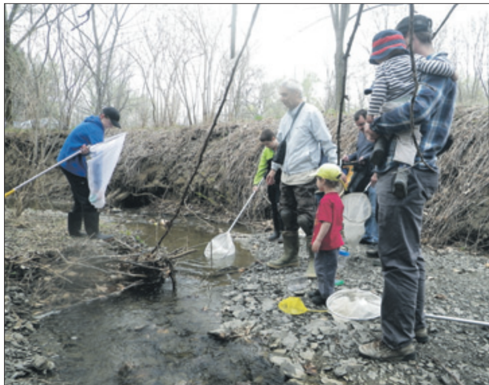
Débutants et observateurs aguerris: vous êtes invités à observer la flore et la faune du parc des Hauts-Fonds en compagnie de guides expérimentés le samedi 21 mai.

Débutants et observateurs aguerris: venez observer la flore et la faune du parc des Hauts-Fonds en compagnie de guides ex-