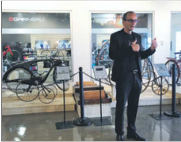
Le musée permet ainsi de découvrir plusieurs belles pièces d'origine nord-américaine datant d'aussi loin que la fin du XIX e siècle.

(YG) Un nouvel espace multifonctionnel à vocation artistique, historique et commerciale voit le jour à Saint-Augustin-de-Desmaures.