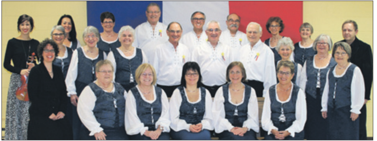
Le chœur Échos d'Arcadie présentera une ode à l'Acadie le dimanche 5 juin à 19 h 30 à l'église Saint Félix de Cap-Rouge, 1460 rue Provancher.

Fondée en 1996 par l'Association acadienne de la région de Québec, le chœur s'est donné comme mission de faire vivre à travers la musique et la chanson, l'histoire de la culture acadienne. Par son répertoire constitué de pièces d'auteurs acadiens et ses arrangements musicaux exclusifs, Échos d'Arcadie propose à son auditoire une mosaïque de sonorités et de rythmes s'inspirant de la mer, du vent du large, des pêcheurs, des villages côtiers et des grands frolics acadiens. Pour information : 418 681-7798. ■