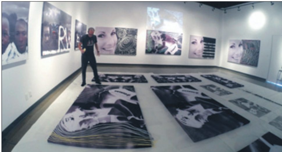
Adjacente au musée, la galerie d'art que Louis Garneau a baptisé le « Art Factory » offre aux visiteurs les dernières œuvres qu'il a réalisées.

Le musée permet ainsi de découvrir plusieurs belles pièces d'origine nord-américaine datant d'aussi loin que la fin du XIX e siècle, traçant ainsi un portrait des plus intéressants de l'histoire du vélo en Amérique.