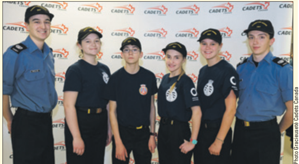
L'équipe du corps de cadets de la marine Cap-Rouge-Saint-Augustin-de-Desmaures lors de la récente compétition provinciale de matelotage à Québec.

Le Programme d'instruction des cadets de la marine enseigne le matelotage aux jeunes de 12 à 18 ans. Que ce soit pour amarrer un bateau au quai ou soulever une charge, on enseigne aux cadets une foule de nœuds et de connaissances nécessaires pour effectuer ces tâches. Chaque année, les cadets de la marine du Québec redoublent d'efforts dans l'espoir d'être sélectionnés pour participer à cette compétition qui met en pratique l'instruction reçue au corps de cadets. ■