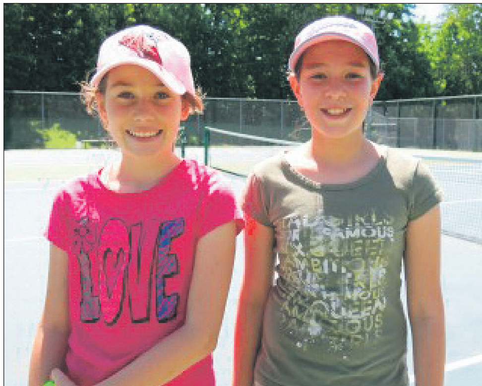
Cet été, les jeunes sont invités à profiter du plein air et à jouer au tennis avec d'autres jeunes de leur âge, de 10 à 15 ans, et de leur calibre.

Il aura aussi la possibilité de gagner des prix de participation. Tout ça pour 10 $! Sachez que le fonctionnement de la ligue des jeunes permet le déplacement des rencontres afin d'accommoder la prise des vacances familiales. Pour obtenir plus d'information ou pour s'inscrire, vous n'avez qu'à consulter le site Web du Club de tennis Saint-Augustin ( www.tennis-st-augustin.com ). ■