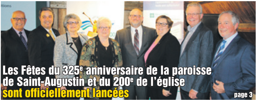
Les Fêtes du 325 e anniversaire de la paroisse de Saint-Augustin et du 200 e de l'église sont officiellement lancées page 3