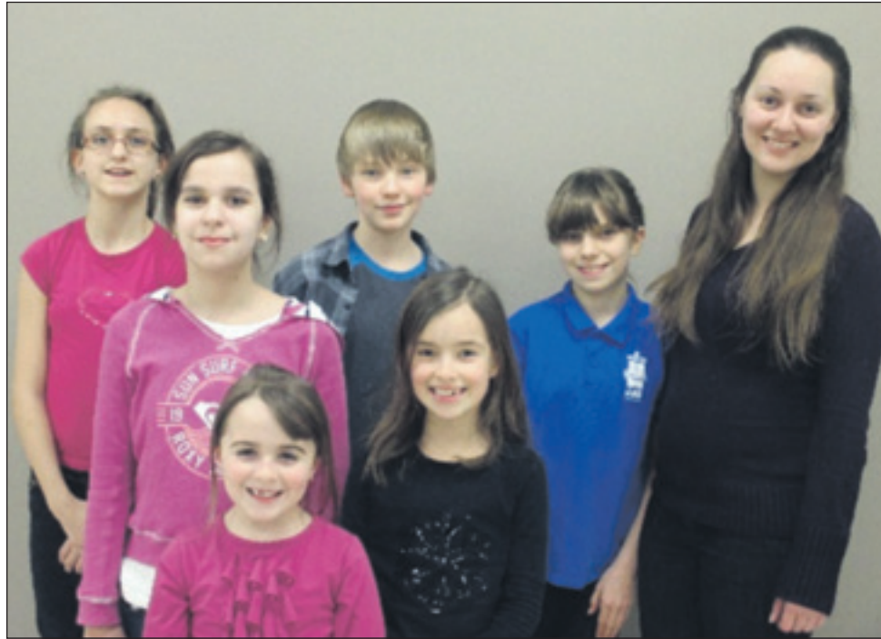
C'est le 5 juin prochain que les Petits Chanteurs La-Mi-Sol vous invitent à voyager avec eux.