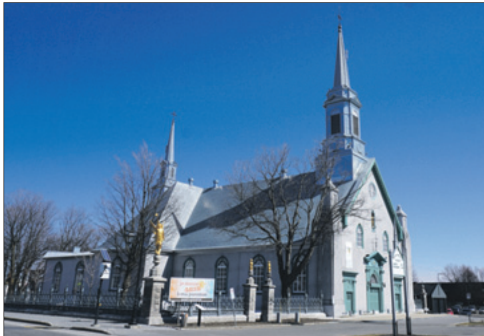
L'année 2016 marquera les 200 ans de votre église patrimoniale et le 325 e anniversaire de la paroisse.

Pour en connaître davantage sur la vie communautaire à Saint-Augustin, abonnez-vous au site Internet : www.paroissesaintaugustin.com . ■