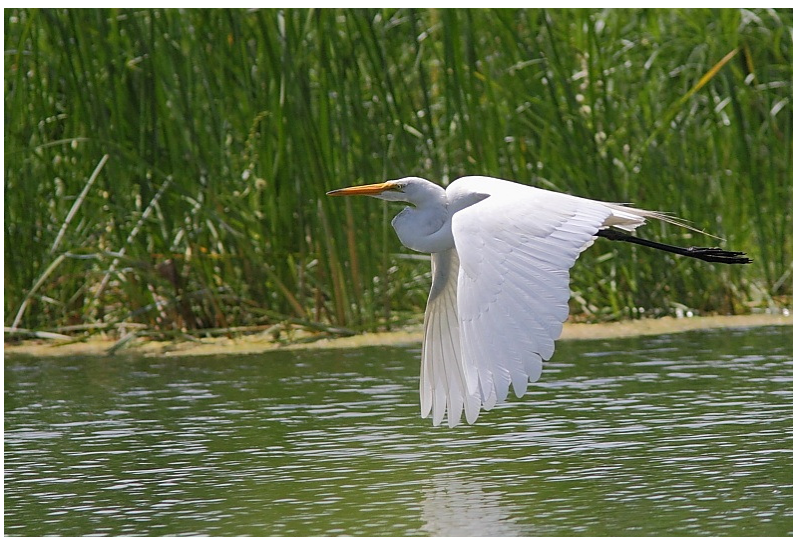
Grande aigrette

Et les dizaines de Mouettes atricilles qui crient en riant (Laughing Gull, en anglais) et chapardent tout ce qui traîne à manger. Quelqu'un m'a dit que sur les tables à pique-nique près du quai, il ne fallait pas tenir son sandwich