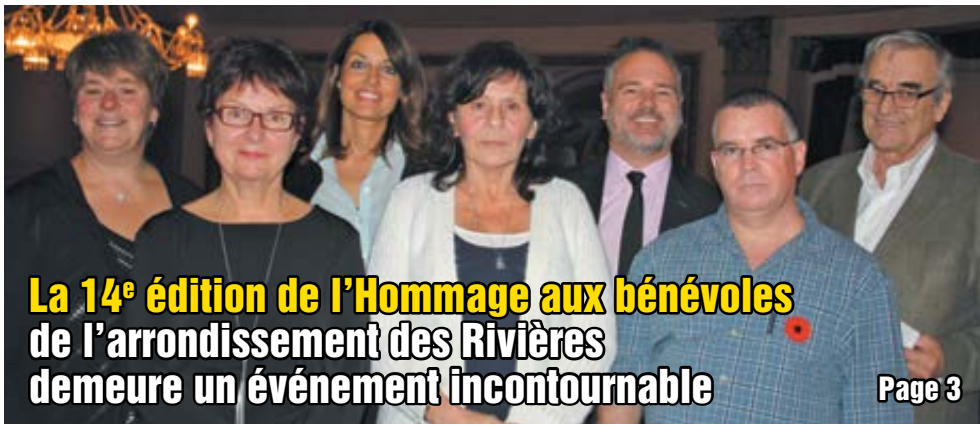
La 14 e édition de l'Homage aux bénévoles de l'arrondissement des Rivières demeure un événement incontournable