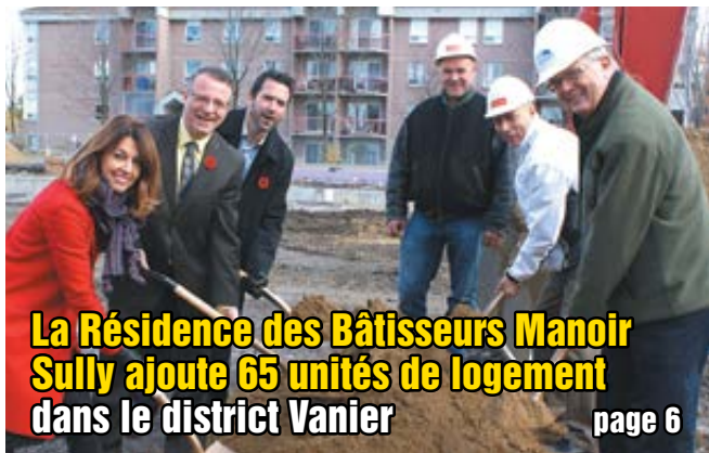
La Résidence des Bâisseurs Manoir Sully ajoute 65 unités de logement dans le district Vanier