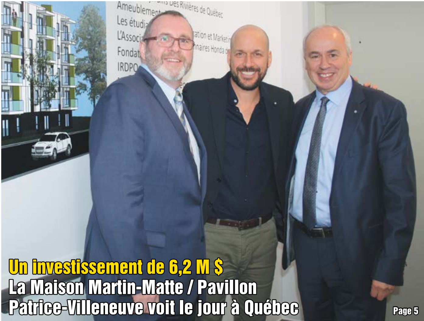
Un investissement de 6,2 M $ La Maison Martin-Matte / Pavillon Patrice-Villeneuve voit le jour à Québec