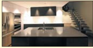
Les condominiums Woodfield-Sillery.

Le 26 octobre dernier avait lieu l'inauguration du plus récent projet de Bilodeau Immobilier, les condominiums Woodfield-Sillery , situé au 1450, avenue du Maire-Beaulieu, à Sillery. Ce sont 150 amis, clients, résidents et médias qui se sont réunis dans le condominium # 615, l'un des spacieux penthouses du bâtiment, transformé en lounge luxueux pour l'occasion. Dès leur sortie de l'ascenseur, au 6 e étage, les invités étaient accueillis par « Mme Woodfield » elle-même, une jolie demoiselle vêtue de feuillus, qui les guidait vers le cœur de la fête. Un des coups de cœur de la soirée : la vaste terrasse avec vue spectaculaire sur le fleuve. Alors que bouchées, vin et cocktails préparés par M. Cocktail en personne, le réputé Patrice Plante, étaient servis, tous pouvaient déambuler d'une pièce à l'autre pour contempler la majestueuse habitation, dans une ambiance chaleureuse créée par les musiciens sur place.