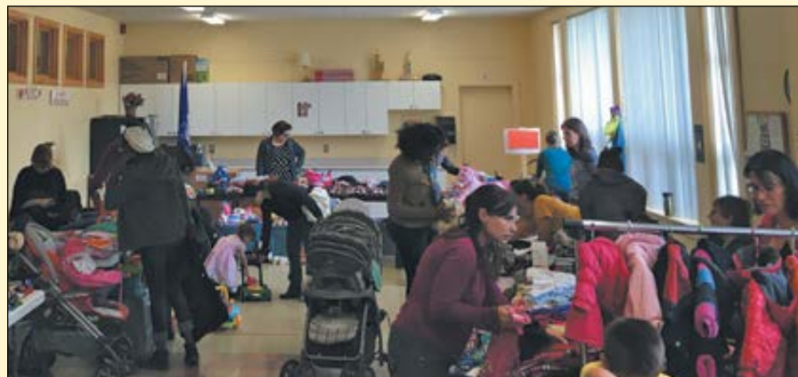
Près de 175 personnes ont visité le Marché des P'tits Voisins.

(YG) Le Centre Ressources Jardin de Familles a accueilli près de 175 personnes à son récent marché aux puces, le Marché des P'tits Voisins. Les familles ont pu se procurer des vêtements, des articles et des jouets destinés aux enfants de 0 à 5 ans. Le prochain aura lieu en avril 2017, à suivre... www.jardindefamilles.org ■