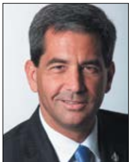
Le député de la circonscription Charlesbourg-Haute-Saint-Charles, M. Pierre Paul-Hus.

(YG) Pour le député de la circonscription Charlesbourg-Haute-Saint-Charles, M. Pierre Paul-Hus, l'heure est maintenant au bilan de sa première année à titre de parlementaire conservateur à la Chambre des communes.