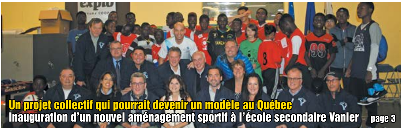
Un projet collectif qui pourrait devenir un modèle au Québec Inauguration d'un nouvel aménagement sportif à l'école secondaire Vanier