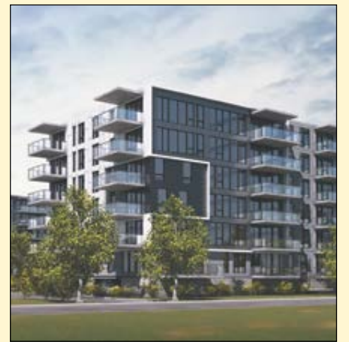
Un tout nouveau développement immobilier voit le jour dans Lebourgneuf, offrant une vue imprenable sur la ville : Les 7 Éléments.