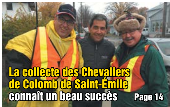
La collecte des Chevaliers de Colomb de Saint-Émile connaît un beau succès