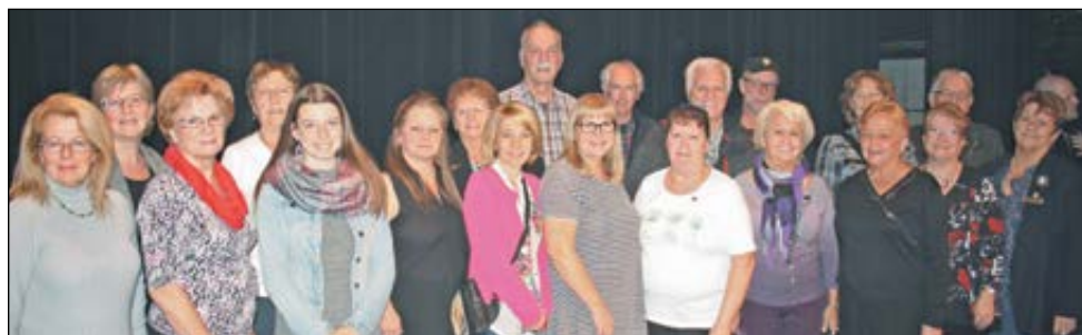
Des bénévoles comptant 5, 10 ou 15 ans au sein d'un même organisme.