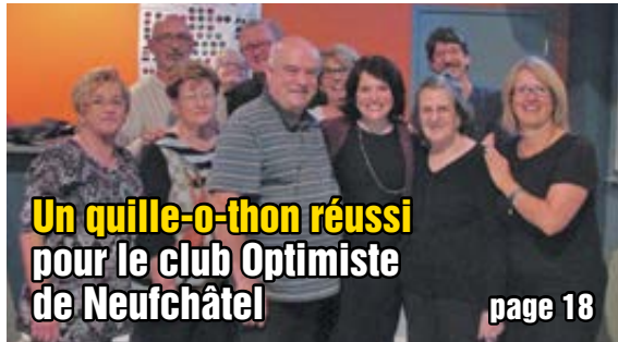
Un quille-o-thon réussi pour le club Optimiste de Neufchâtel