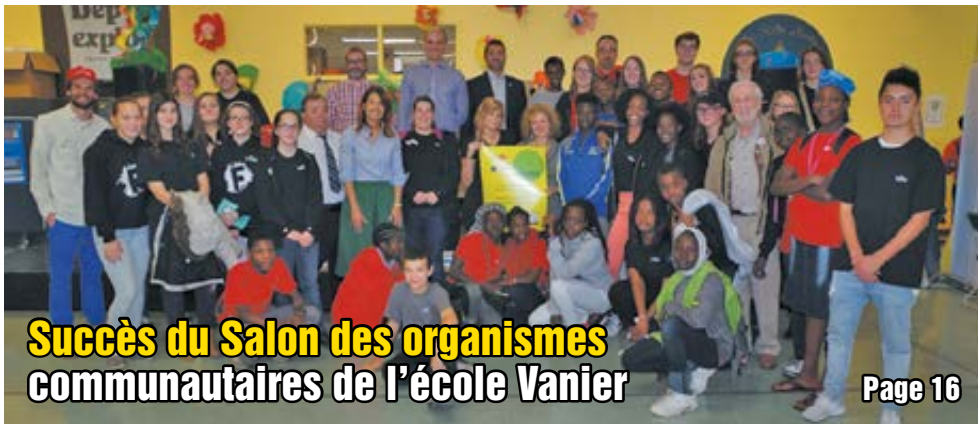
Succès du Salon des organismes communautaires de l'école Vanier