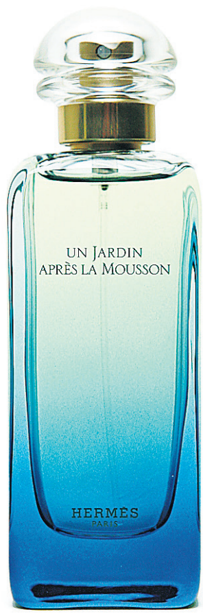
UN JARDIN APRÈS LA MOUSSON D'HERMÈS (145$ les 100 ml)

Après Un jardin en Méditerranée et Un jardin sur le Nil , le parfumeur de la maison Hermès, Jean-Claude Ellena, ajoute une troisième eau à la collection. Cette fois, il nous entraîne en Inde, et capture l'odeur de la nature après la saison des pluies. Résultat: une fragrance épicée et végétale, convenant autant aux hommes qu'aux femmes.