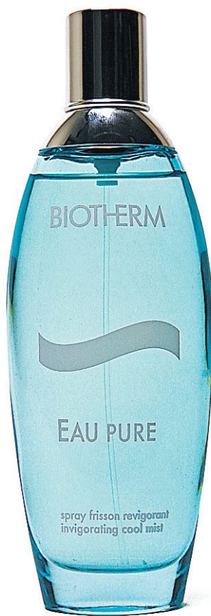
EAU PURE DE BIOTHERM (49,50$ les 100 ml)

Au début, une puissante note d'écorce de citron vert mêlée aux poivres et épices se manifeste. Puis, celle-ci s'harmonise sous l'effet du melon Galia sans toutefois devenir fruitée. Au contraire, l'odeur rappelle la fraîcheur de l'eau. Elle s'éclipse tranquillement pour laisser place aux notes de fond: le gingembre et vétiver. Cette tonalité donne au parfum une personnalité masculine forte intéressante.