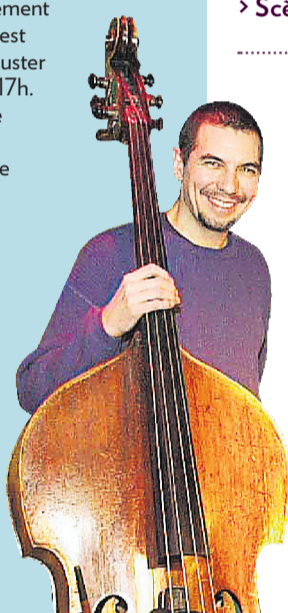
Normand Guilbeault PHOTO LA PRESSE