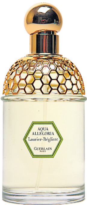
AQUA ALLEGORIA DE GUERLAIN (53$ les 75 ml)