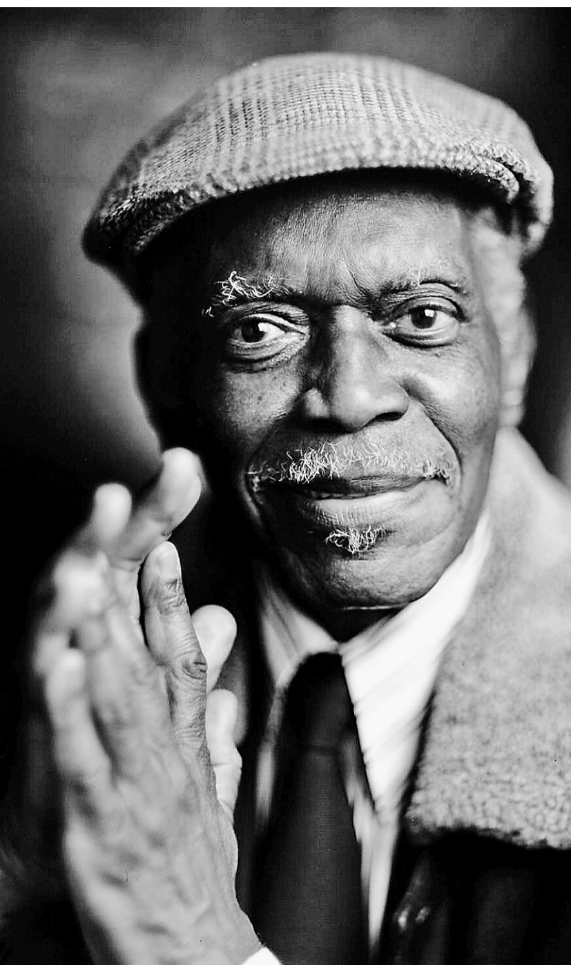
« Je m'estime chanceux d'avoir eu la santé pour jouer toute ma vie et ainsi avoir obtenu un revenu adéquat pour ma famille », dit Hank Jones.

La voix grave et posée. La pensée claire et lumineuse. La modestie et l'assurance des grands. Le pianiste Hank Jones aura 90 ans le 31 juillet prochain, mais son jeu demeure d'une incroyable limpidité, les harmonies y sont parfaitement exposées sur les ivoires, le doigté est encore fluide et précis même s'il a perdu de la vélocité. Ce qui ne l'empêchera pas de donner quatre concerts pendant le festival!