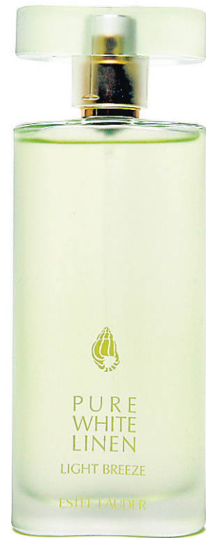
PURE WHITE LINEN, LIGHT BREEZE D'ESTÉE LAUDER (78$ les 100 ml)

Les secondes fragrances sont également fraîches et vivifiantes. Pamplemousse rappelle l'éclat des agrumes, accentué par le gingembre et le freesia, tandis que l'eau de Poire éveille la délicatesse de ce fruit. Celle-ci est rehaussée par un zeste de bergamote et de citron qui s'harmonise à quelques notes fleuries. Toutes deux se terminent par un fond boisé, délicatement sensuel.