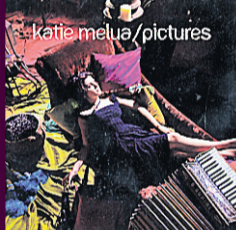
KATIE MELUA / PICTURES

KATIE MELUA PICTURES DRAMATICO / UNIVERSAL ★★ ½