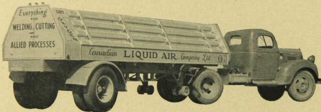
Une des grandes remorques L.A. qui transportent 30,400 pi. cu. d'Oxygène

Que vous employiez des gaz industriels en fortes quantités ou que vous n'utilisiez que quelques tubes par semaine, vous pouvez compter sur le meilleur service, en tout point, de L.A., le plus grand producteur du Canada. De ses 17 centres de distribution, commodément situés par tout le pays, vous pouvez obtenir rapidement les gaz les plus purs, livrés de la façon qui convient le mieux à vos besoins: en fort volume par camions-citerne, en tubes individuels, ou même par canalisation directe dans votre usine.