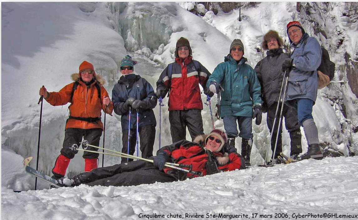
Cinquième chute, Rivière Ste-Marguerite, 17 mars 2006

← CONSULTER LE SITE INTERNET DE L'ARUQAC: http://www.uqac.ca/~aruqac/ →