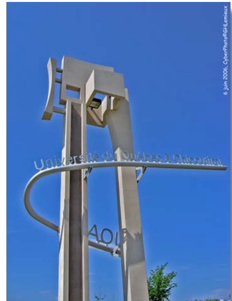
Une nouvelle stèle symbolique à la hauteur des aspirations de l'UQAC