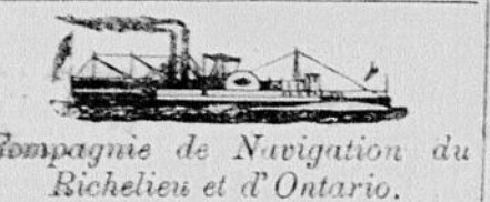
Compagnie de Navigation du Richelieu et d'Ontario.

LIÈGE DE LA MALLE ROYALE ENTRE QUÉBEC, MONTRÉAL, KINGSTON, TORONTO, HAMILTON, ET TOUS LES PORTS INTERMÉDIAIRES.