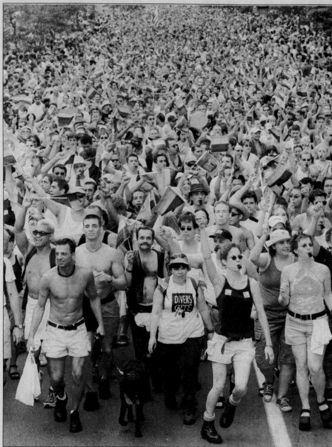
600 000 personnes ont assisté au défilé de la Fierté gaie.

Le Devoir est publié le lundi au samedi par Le Devoir Inc. dont le siège social est situé au 2050, rue De Bleury, 9 e étage, Montréal, (Québec), H3A 3M9. Il est imprimé par Imprimerie Québec St-Jean, 800, boulevard Industriel, Saint-Jean sur le Richelieu, division de Imprimeries Québec Inc., 612, rue Saint-Jacques Ouest, Montréal. L'Agence Presse Canadienne est autorisée à employer et à diffuser les informations publiées dans Le Devoir . Le Devoir est distribué par Messageries Dynamiques, division du Groupe Québec Inc., 900, boulevard Saint-Martin Ouest, Laval. Envoi de publication — Enregistrement n° 0858. Dépôt légal: Bibliothèque nationale du Québec.