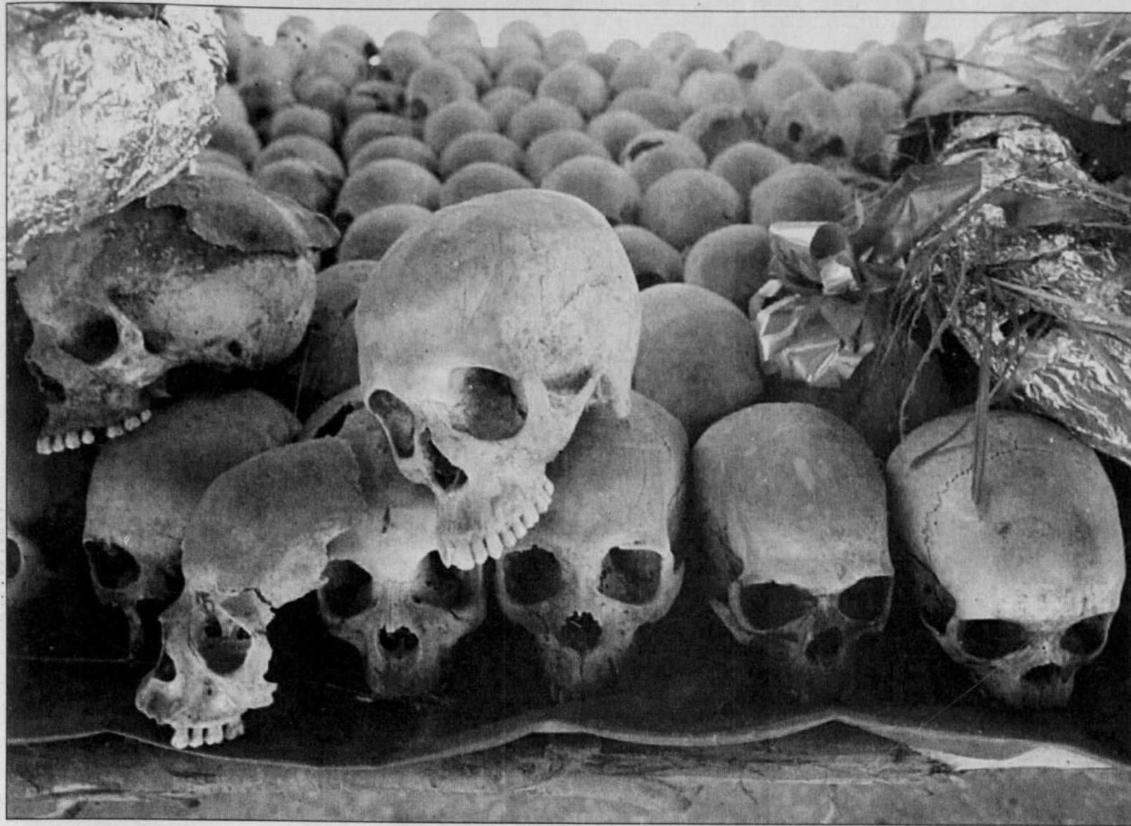
Un monument à la mémoire des victimes du génocide rwandais a été érigé près d'une église au sud de Kigali. En 1994, le génocide rwandais a été directement causé par des dérives intellectuelles racisantes.

Une thèse contestée sur l'intelligence et la pauvreté