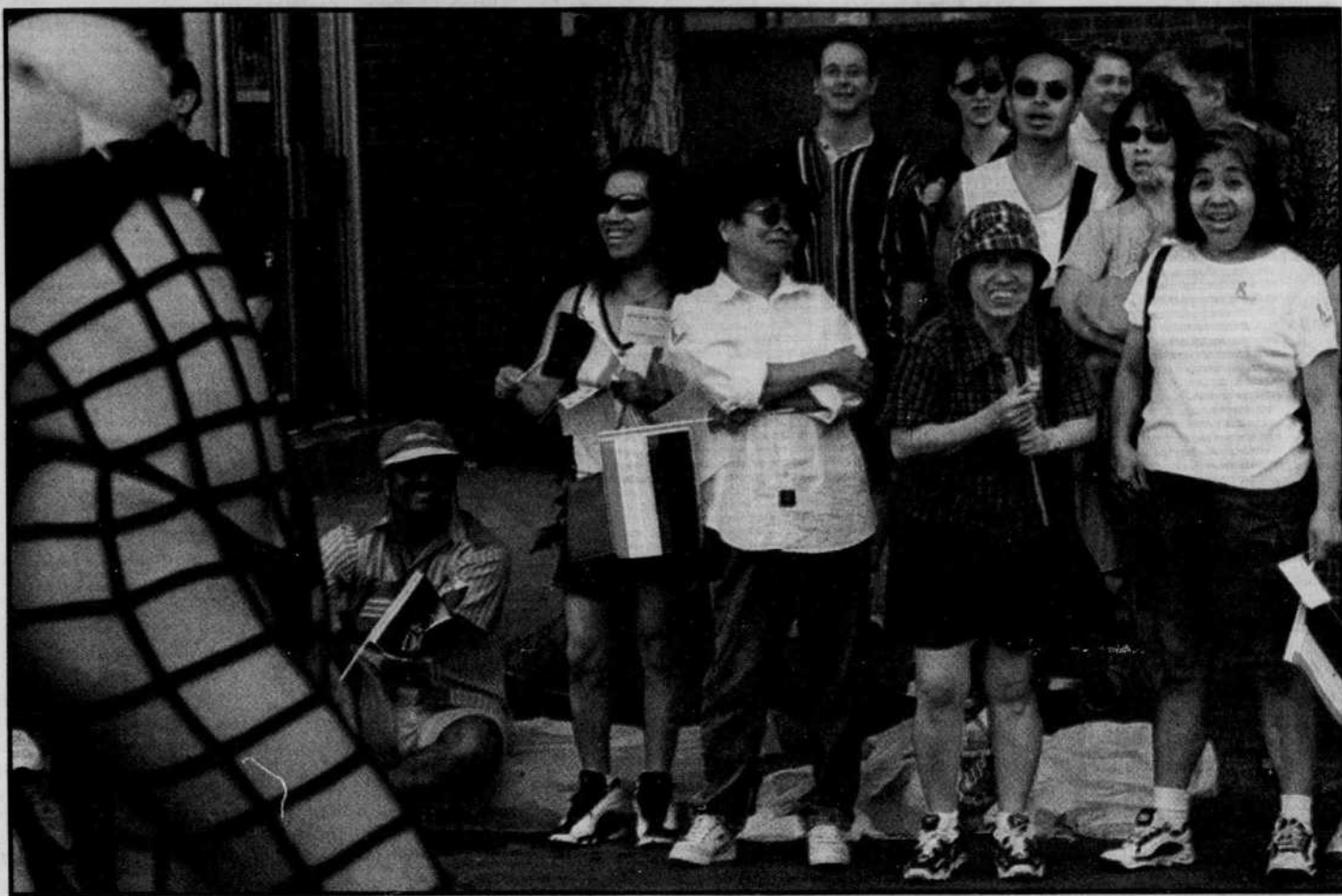
Étonnée, choquée, gênée, amusée, interloquée, le défilé de la Fierté a provoqué toutes sortes de réactions hier, boulevard René-Lévesque.