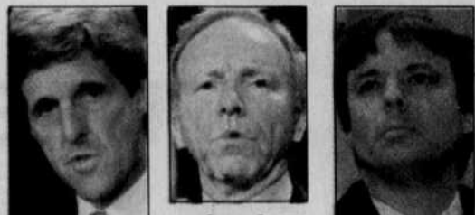
John Kerry Joseph Lieberman John Edwards