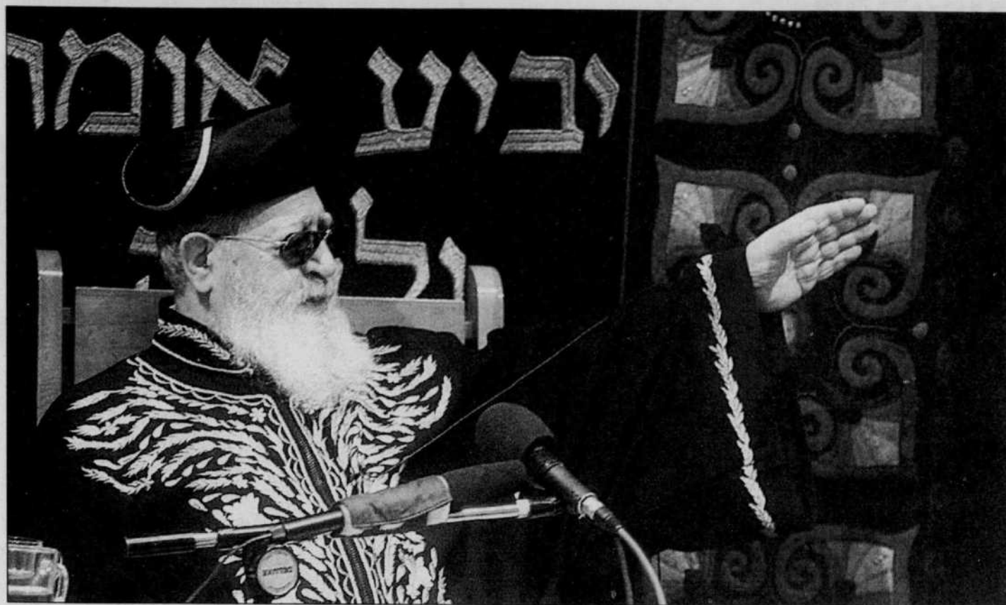
Le rabbin Ovadia Yossef, chef spirituel du parti ultra-orthodoxe Shass, dans une synagogue de Jérusalem hier: indignation générale.

Washington (AFP) — L'ex-président américain Gerald Ford se remettrait hier d'une intervention chirurgicale à la langue destinée à y enlever un abcès, ont annoncé des médecins. Des chirurgiens, qui l'ont opéré samedi, ont indiqué que le pronostic était «excellent» et que la biopsie n'avait pas révélé de tumeur maligne.