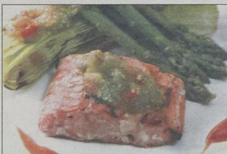
De toutes les clés, la plus importante, c'est l'alimentation.

Mais l'alimentation n'est pas tout. Associée à des activités physiques régulières, elle aura pour effet d'apporter une bonne gestion des calories. En ce qui a trait au stress, il serait intéressant de faire le bilan de ce qui nous cause des soucis et d'y apporter les correctifs nécessaires. En développant sa spiritualité, il sera plus facile de gérer nos pensées et de les rendre plus positives.