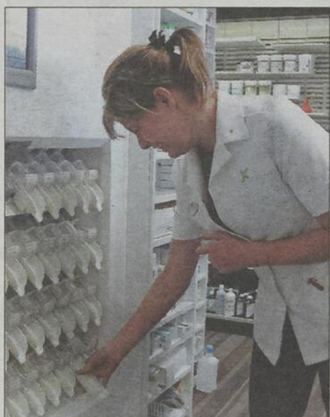
La Parata Mini permet de réduire le temps d'attente au comptoir.

Pour finir, la pharmacie s'est dotée d'une PACVision, un équipement à la fine pointe de la