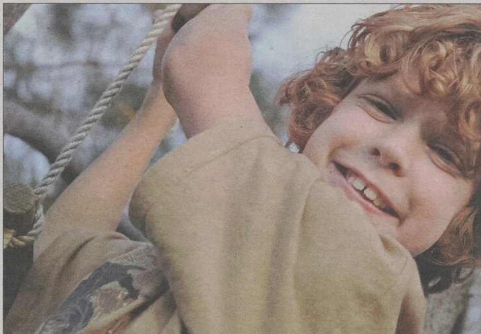
Méconnu, le TDAH est un trouble neurologique affectant les neurotransmetteurs du cerveau.

Sans suivi médical ou psychosocial, l'enfant souffrant d'un TDAH présentera malheureusement souvent des résultats scolaires décevants et aura de la difficulté à avoir des relations sociales et familiales harmonieuses.