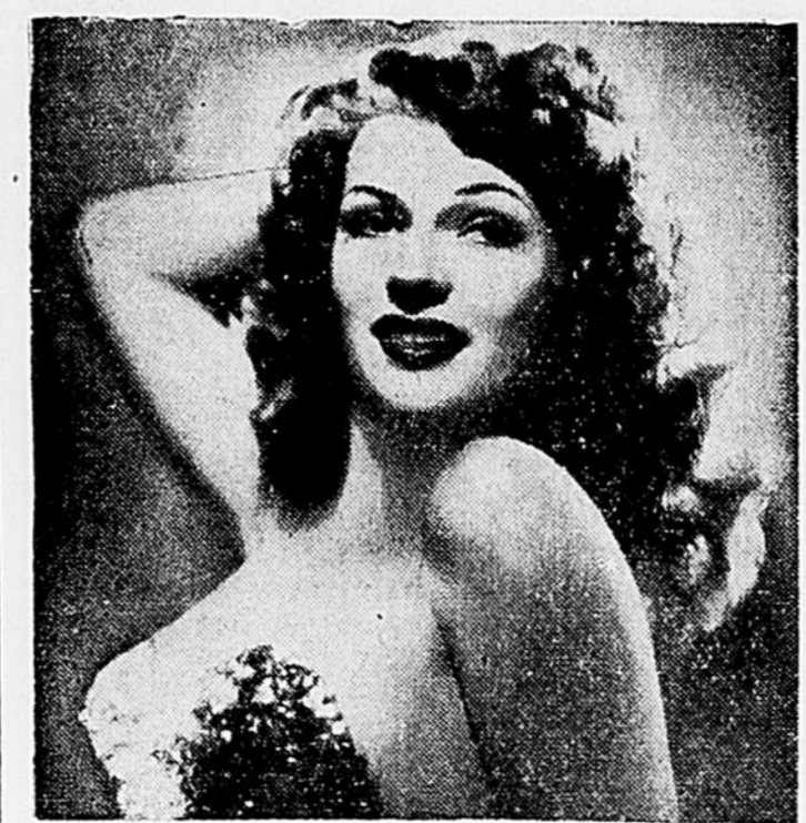
La jolie Rita Hayworth qui joue le premier rôle féminin dans le grand fil musical "YOU WERE NEVER LOVELIER" à l'affiche du populaire théâtre Maska pour dimanche et lundi.