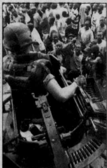
Un soldat français tente de contenir la foule mécontente à l'aéroport d'Abidjan.