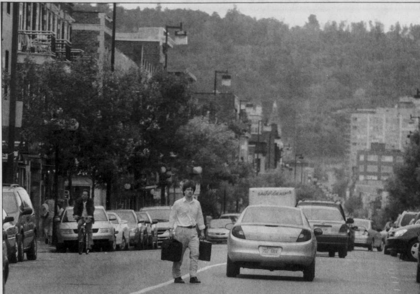
L'organisation de la première journée sans voitures à Montréal ne s'est pas faite sans mal.

Pas de voitures dans 1321 villes du monde