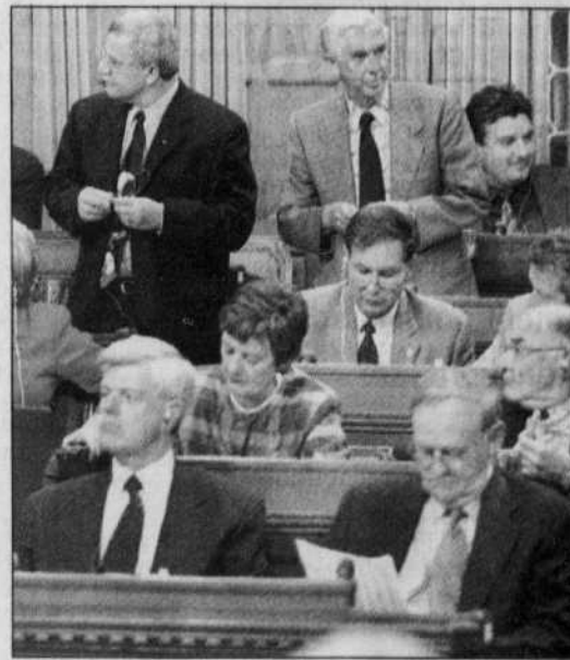
Jean Chrétien et John Manley lors du vote de cette semaine.

La tentation de faire de même sera grande pour Paul Martin, y résister, un défi. «La première fois qu'une question suscitera un débat ou qu'un comité s'empêtrera dans ses travaux, tout le monde, médias y