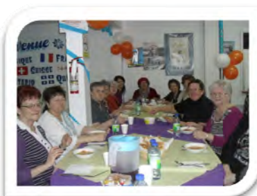
Au Carrefour de la soupe

alimentation saine et à faible coût pour les gens dans le besoin.