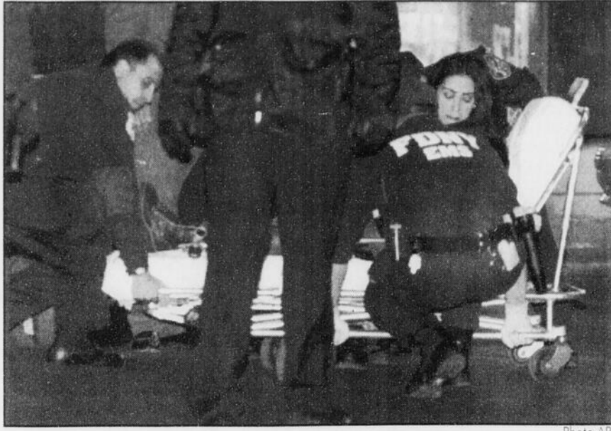
Une personne a été tuée dans la fusillade de l'Empire State Building et six autres ont été blessées. Un enfant se trouvait parmi les personnes visées.

La fusillade a eu lieu à 17h15 (22h15 GMT, 23h15 à Paris) au cours d'une journée ensoleillée, le type de journée qui attire généralement des centaines de touristes sur la plate-forme d'observation de l'Empire State Building. Aucune précision n'a cependant été donnée sur le nombre exact de