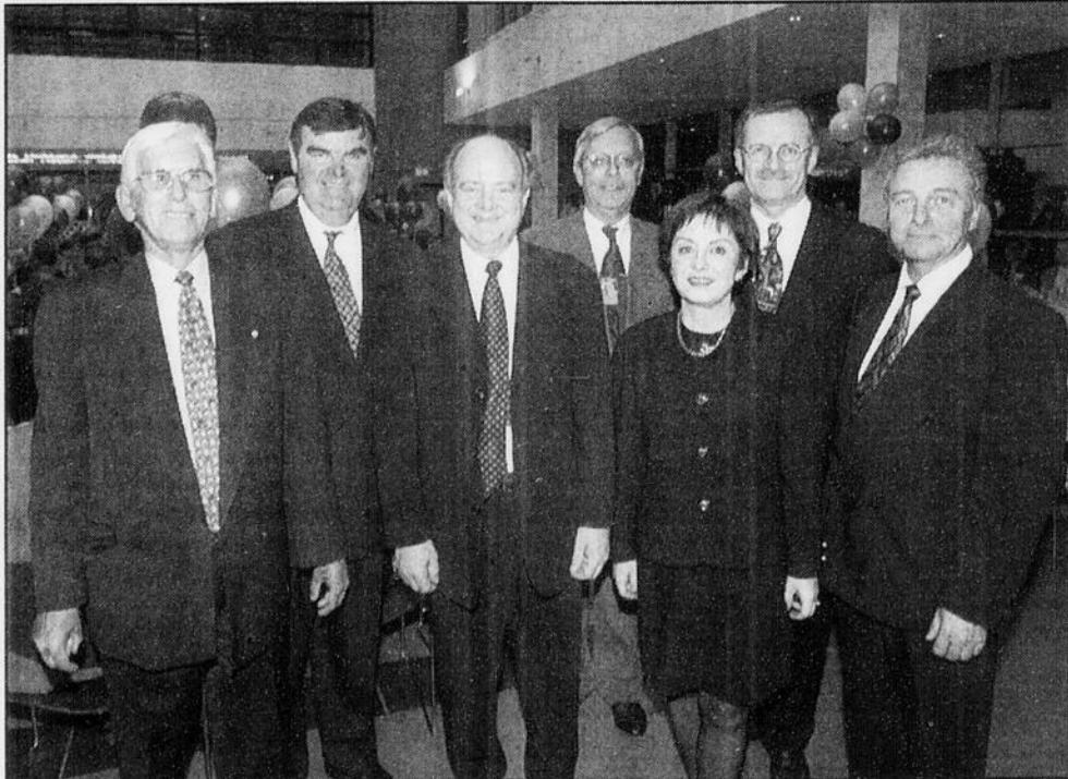
Imacom-Daguerre par René Marquis