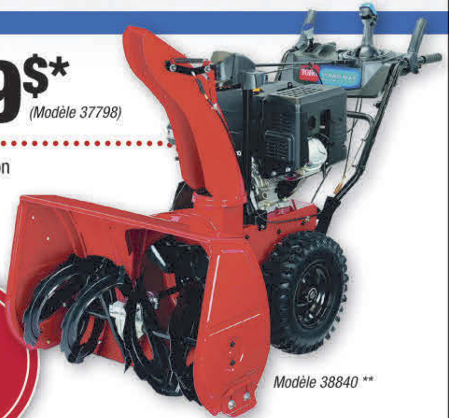
Modèle 38840 **

GARANTIE 3 ANS TRANSPORT, LIVRAISON ET PRÉPARATION INCLUS.