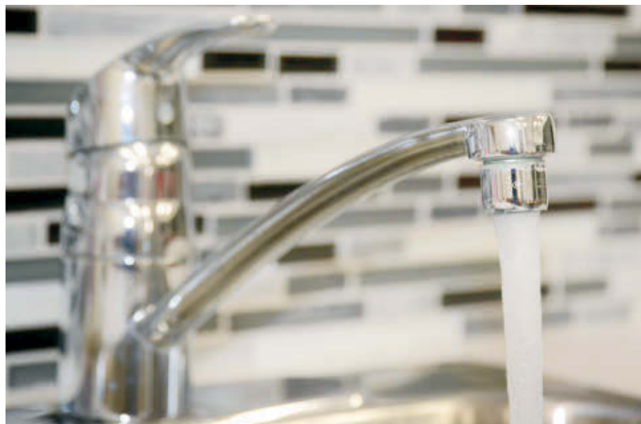
La Ville d'Acton Vale, qui a dû émettre un avis d'ébullition de l'eau la semaine dernière, assure que l'eau du robinet est de qualité.

« Nous travaillons en équipe avec le ministère de l'Environnement et la santé publique. Et notre usine de filtration respecte en tous points les exigences du Règlement sur la qualité de l'eau potable », déclare-t-elle.