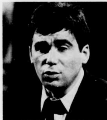
Mouloudji et Claude Nougaro