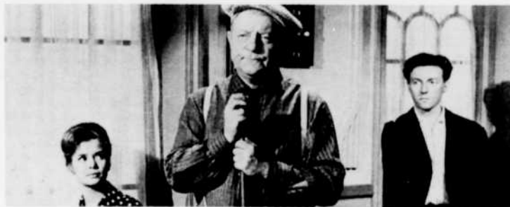
"Rue des prairies"