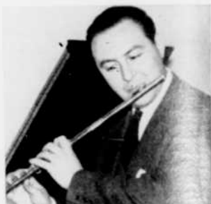
Jean-Pierre Rampal, au "Concert" de lundi soir à 8 h. 30.