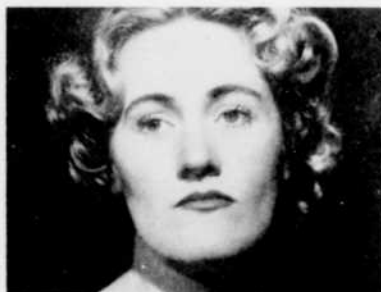
Joan Sutherland chantera des "Airs d'opéras", mercredi soir à 10 h. 30.