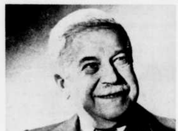
Arthur Schnabel jouera l'"Intégrale" des concertos de Beethoven, du lundi au vendredi à 7 heures.