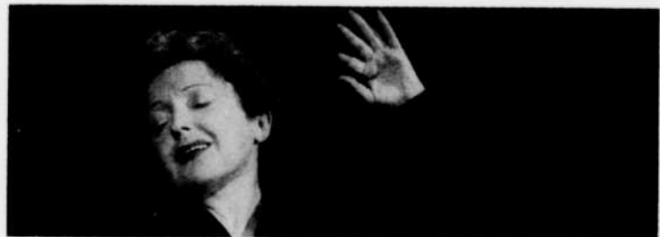
Le thème de "Croyez-vous?" du samedi soir 20 novembre à 10 h. 45: "Comment la foi se manifesta dans la vie d'Edith Piaf".