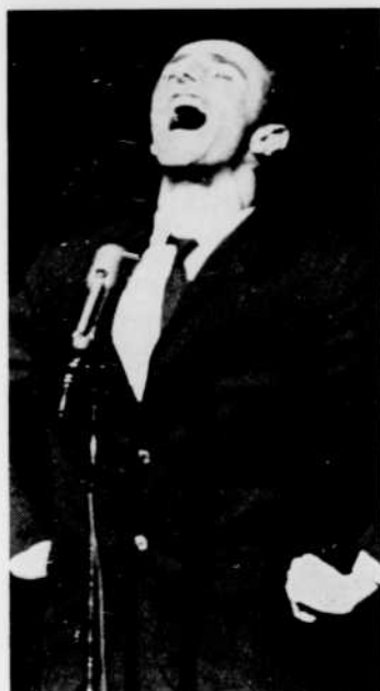
Les Frères Jacques