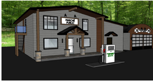
Les rénovations prévues à l'actuel bâtiment

Les municipalités du Témiscamingue font preuve d'initiative et d'audace pour offrir à la population des milieux de vie de qualité et Moffet ne fait pas exception à la règle. En effet, la municipalité a récemment fait l'acquisition de l'ancien magasin général du village qui était fermé depuis maintenant deux ans dans le but d'en faire un marché public permanent bonifié.