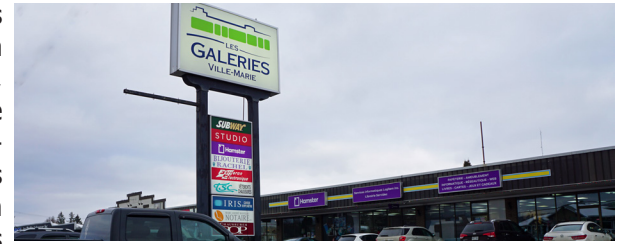
Plusieurs commerçants avaient vu leurs achats diminuer de façon drastique à la suite de la création des Centres intégrés de Santé et Services sociaux, notamment au niveau de la papeterie.

Cabinet du président du Conseil du Trésor, les données extraites du système électronique d'appel d'offres (SEAO) et du registre des entreprises du Québec démontrent qu'au cours des quatre dernières années, parmi les 82613 contrats octroyés par les organismes publics assujettis à la LCOP, 82 % l'ont été à des PME.