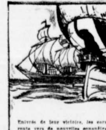
TARZAN Episode No 34