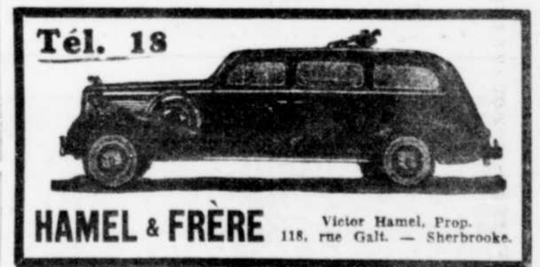
HAMEL & FRÈRE