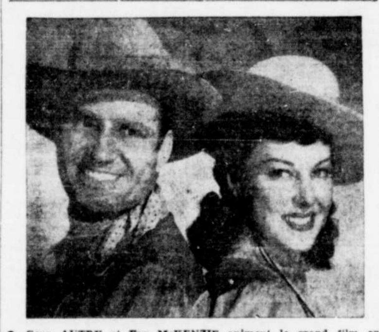
Gene AUTRY et Fay MCKENZIE animent le grand film en musique "HEART OF THE RIO GRANDE" qui passera à l'écran du PREMIER de demain à samedi. On y entendra Gene dans plusieurs chansons enlevantes, et l'on verra, naturellement beaucoup d'action aussi. Le deuxième grand film, "FRAMED" raconte la lutte que la loi et la presse livrent contre les maîtres-chanteurs qui extorquent des millions de dollars chaque année à leur victime. Le programme comprend encore le deuxième chapitre de "RIDERS OF DEATH VALLEY" avec huit célèbres artistes. (R)