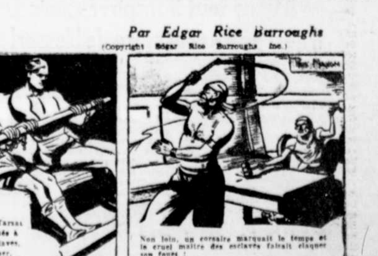
TARZAN Esclaves aux rames Par Edgar Rice Burroughs