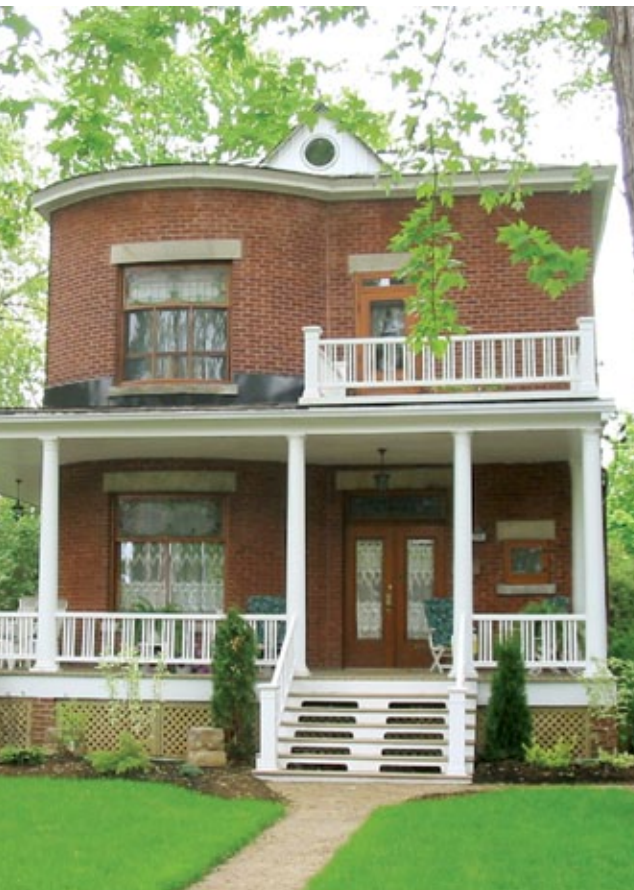
Lauréat de l'arrondissement d'Ahuntsic-Cartierville en 2004

L'Opération patrimoine architectural de Montréal aura cette année 20 ans. Cet événement a été instauré par la Ville de Montréal, en collaboration avec Héritage Montréal. Son objectif principal est de sensibiliser la population à la richesse du patrimoine bâti et à sa préservation.