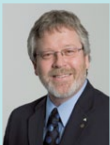
Gérald Tremblay Maire de Montréal