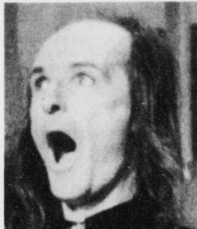
Kim Mitchell est le favori pour le Juno du plus grand succès, mais l'industrie du disque s'intéresse avant tout à ce qui se vend massivement, si bien qu'il sera difficile de résister à Alannah Myles, pour Black Velvet.