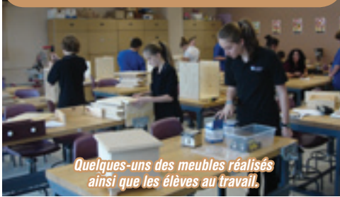
Quelques-uns des meubles réalisés ainsi que les élèves au travail.

À l'école Jean-Raimbault, l'ébénisterie figure parmi l'éventail des activités offertes le midi. Cette activité a vu le jour il y a 3 ans, à partir de l'intérêt manifesté par certains élèves pour le travail à l'atelier et leur désir d'élargir leurs connaissances dans ce domaine.