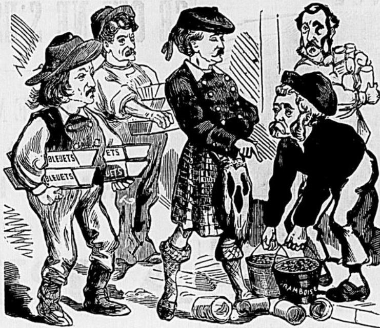
LE MARCHÉ DE QUEBEC.

—Tu te rappelles l'orage de hier au soir. J'étais à table avec Loulou, Bichon, Fanny,—avec tous ceux enfin que je ne craignais pas d'appeler encore "les chers minets."—Je leur avais fait une petite pâtée dont ils se délectaient. Bientôt la pluie éclate, la foudre gronde. Les chers minets ne disaient rien, mais un éclair plus vig que les autres me fait faire un signe de croix. Aussitôt, crac ! les voilà qui disparaissent dans toutes les directions. On aurait dit que