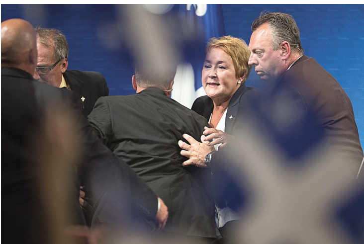
Le discours victorieux de Pauline Marois avait été interrompu abruptement par deux gardes du corps avertis de la tentative d'attentat en cours.

Les images tournées par deux caméramans qu'avait embauchés Yves Desgagnés pour immortaliser le jour de l'élection nous montrent l'atmosphère qui régnait dans les coulisses lorsque l'assailant a tenté de s'introduire dans la salle : les gardes du