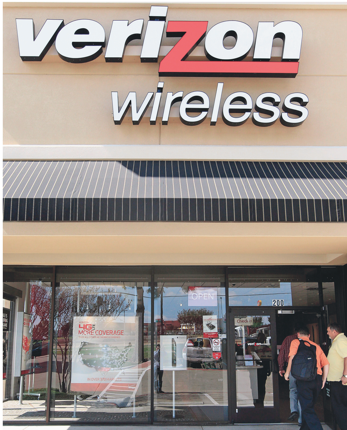
Verizon, qui s'était récemment montrée intéressée par le marché canadien, affichait des revenus totaux de 115,8 milliards de dollars américains en 2012 et quelque 98 millions d'abonnés, soit environ quatre fois plus que tous les opérateurs canadiens.

Dans un tel contexte, on comprend pourquoi la prochaine enchère de fréquence dans la bande de 700 MHz revêt une importance particulière pour ces nouveaux venus qui voudront profiter de l'explosion de la demande de services sans-fil pour accroître leur clientèle. C'est également vrai pour les opérateurs titulaires en raison de l'efficacité marquée de cette fréquence pour les transmissions rapides et sur de longues distances.