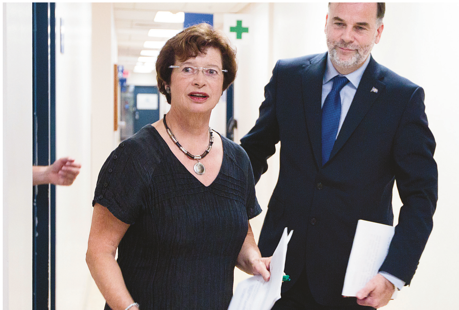
Les ministres Marie Malavoy et Pierre Duchesne veulent que les jeunes Québécois connaissent mieux leur histoire.

Avec La Presse canadienne et l'Agence France-Presse Le Devoir