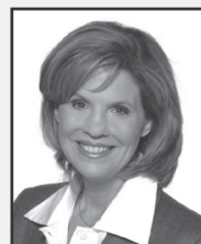
Liza Frulla Ancienne députée