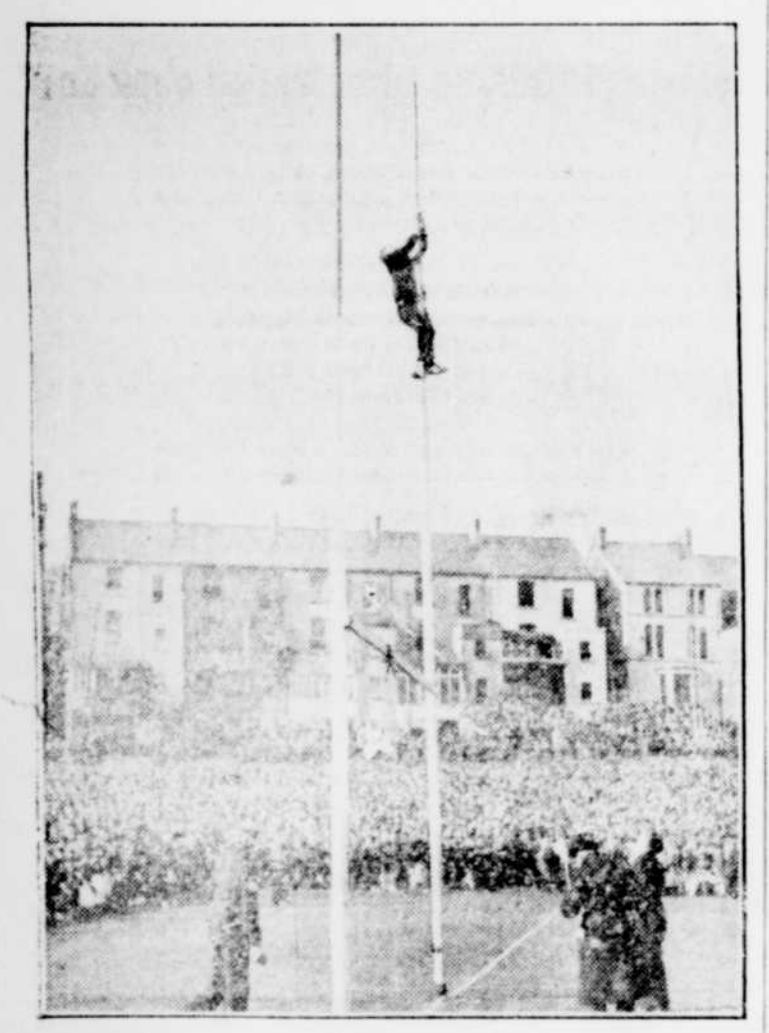
Un jeune Galois grimpe au haut d'un poteau frais peinture d'un des buts du terrain de rugby pour le couronner d'un poteau, lors d'une partie de rugby entre les Galles et l'Irlande. Les Galles ont gagné par 13 à 0, ce qui porte les Galles à dire que leur emblème national a eu quelque chose à faire dans ce résultat.

— M. Ernest Leriche à Disraeli par affaires.