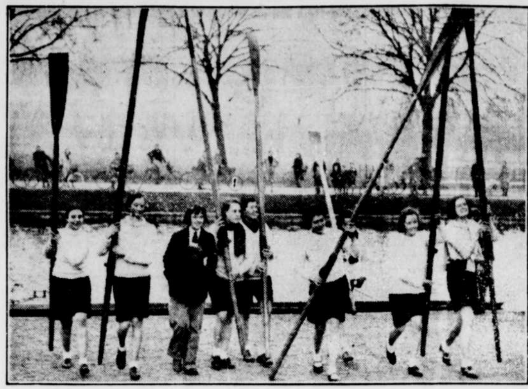
Le Cambridge peut se vanter des nombreuses victoires que leur équipe a remportées sur l'Oxford, mais voici une formidable équipe que les "Beau Clair" ne peuvent battre. Les étudiants d'Oxford (ci-dessus), viennent de battre les étudiants de Cambridge par trois secondes dans la course annuelle d'un demi-mille. Elles n'ont pas l'air d'être si fatiguées de l'effort considérable qu'elles viennent de fournir. Cette course a été inaugurée il y a quatre ans.

A SOUTHERN MAID NATALIE MOORHEAD et CONWAY TEARLE dans KING MYSTERY. AUTRES ATTRACTIONS.