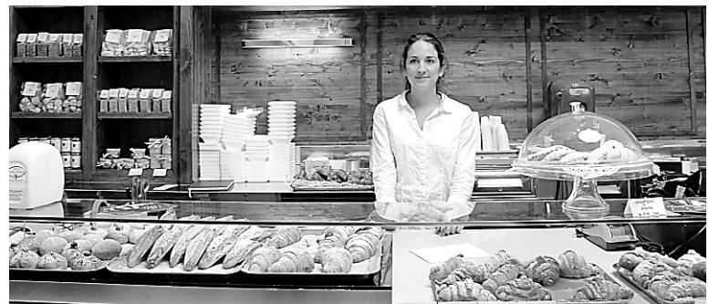
Le comptoir chez Dolci della Nonna Vicenza, où l'on peut déjeuner à la sicilienne.

Si vous avez envie d'aller faire un peu de magasinage dans des boutiques fréquentées par les Romains et non par les touristes (avec les prix en conséquence), allez faire un tour via Marconi, de l'autre côté du Tibre, mais pas trop, trop loin. C'est hors circuit, mais on y est dans la vraie Rome, celle des gens qui vont travailler et rentrent le soir, en Vespa ou à pied avec leurs enfants. Chouette à observer en sirotant un chinotto (boisson gazeuse aux herbes). Pour commencer la visite, on peut demander au chauffeur de taxi de nous emmener (ou y aller en métro ou à pied) à la succursale de la Feltrinelli, la grande librairie italienne — qui offre de tout, un peu comme Renaud-Bray ici. Une fois rendu là,