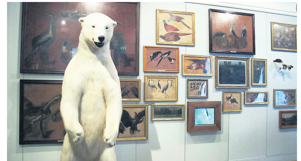
Le Musée de la Chasse et de la Nature abrite une collection d'œuvres d'art qui représentent la faune et la chasse au cours des âges.