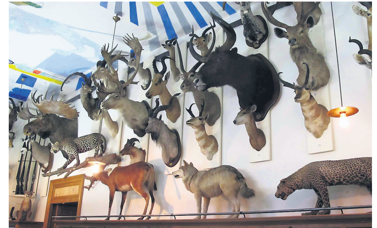
Le Musée de la Chasse et de la Nature exploite entre autres le thème des produits de la chasse : on peut y admirer des trophées et des animaux naturalisés.