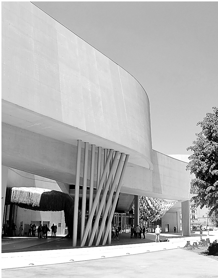
Le Musée des arts du XXI e siècle de Rome