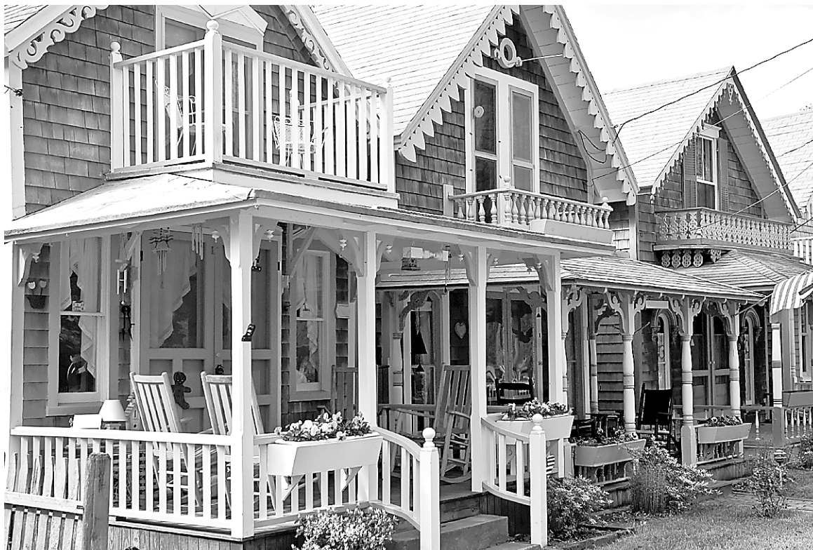
On trouve une architecture riche à Oak Bluff, mais ce sont surtout les 300 gingerbread cottages colorés, qui ressemblent justement à des maisons en pain d'épice, qui étonnent.

À Oak Bluffs, on change d'atmosphère. Fréquenté par les gens du coin, l'endroit est tapageur. C'est plein de restaurants et de bars qui donnent sur la marina. Une charmante plage est située tout près des rues animées. Là aussi, on trouve une riche architecture avec