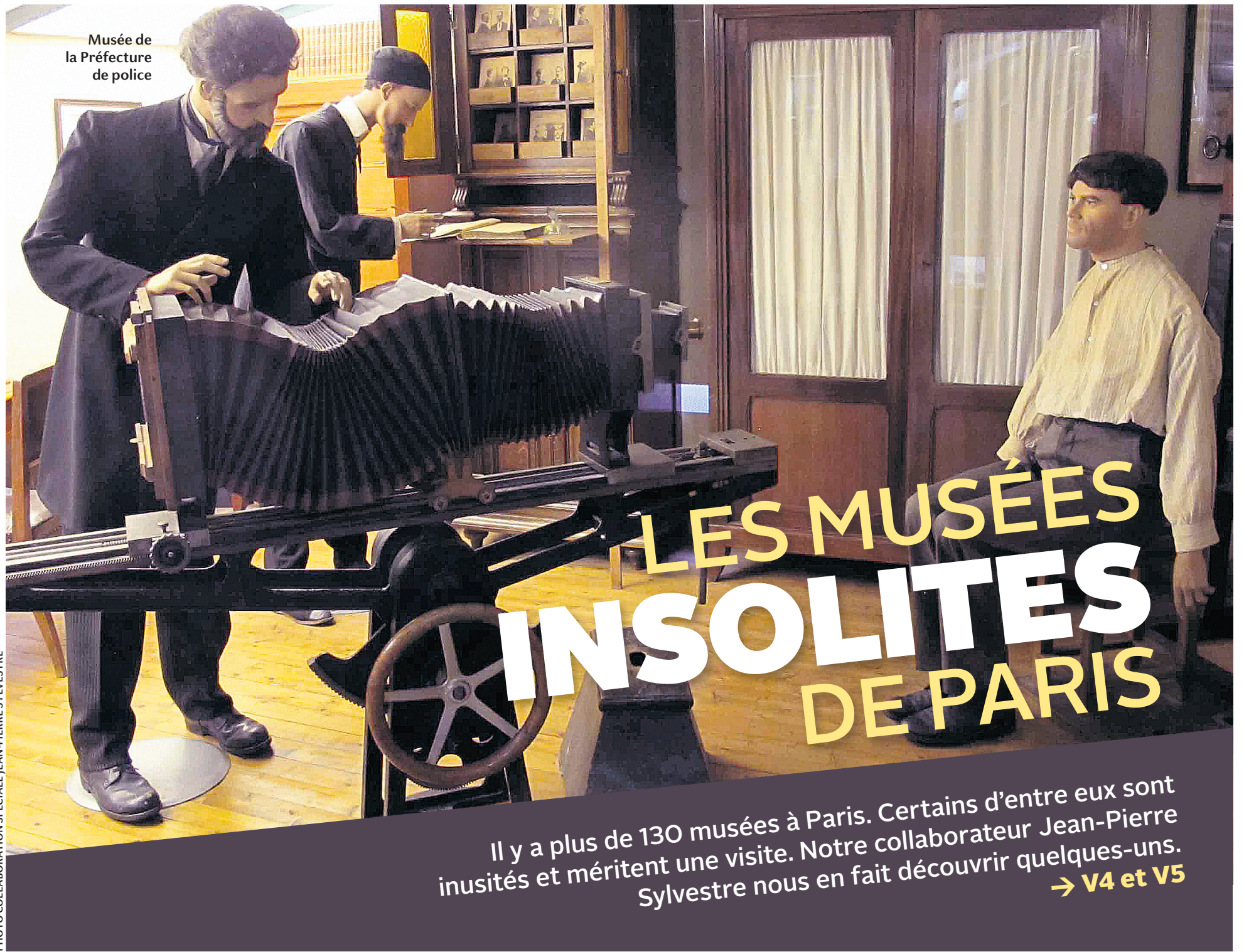
Musée de la Préfecture de police