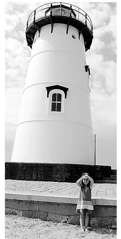
Le phare d'Edgartown

beaucoup de villas de style Queen Anne et néogothique, mais ce sont surtout les 300 gingerbread cottages qui étonnent. Construites au XIX e siècle par des méthodistes, ces petites maisons aux couleurs criardes, cordées comme des sardines, ressemblent à des maisons en pain d'épices.