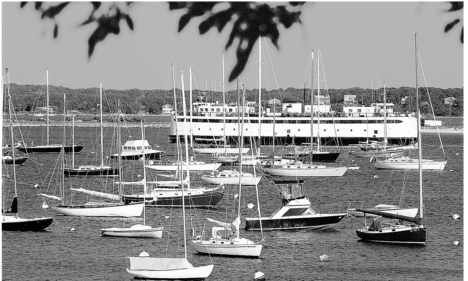
Pour se rendre à Martha's Vineyard, il faut prendre le traversier jusqu'à Vineyard Haven, une des six localités de l'île.