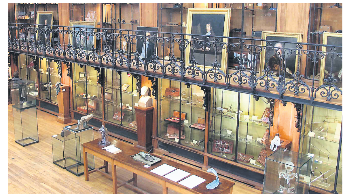
Le Musée de la Faculté de médecine présente toute une collection inédite d'instruments de chirurgie de la préhistoire au siècle dernier.