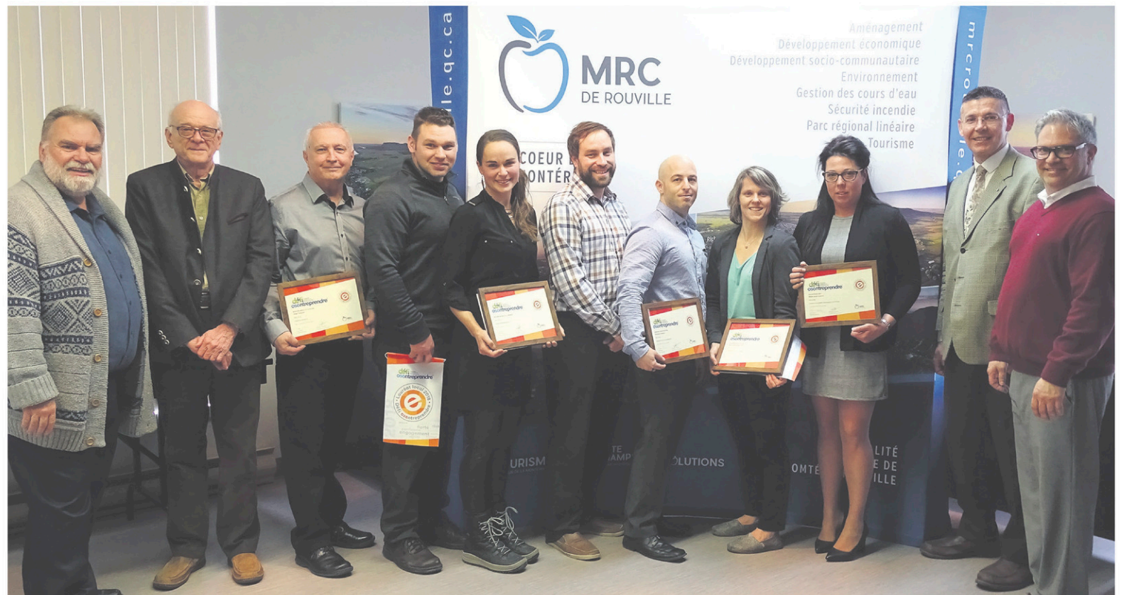
Les lauréats et partenaires du Défi OSEntreprendre de la MRC de Rouville de 2018.

La MRC de Rouville, par le biais du Défi OSEntreprendre, est fière de collaborer à inspirer le désir d'entreprendre pour contribuer à bâtir un Québec fier, innovant, engagé et prospère. C'est en faisant rayonner les initiatives entrepreneuriales locales et en mobilisant les partenaires de la région que nous démontrons tout le dynamisme du Cœur de la Montérégie.