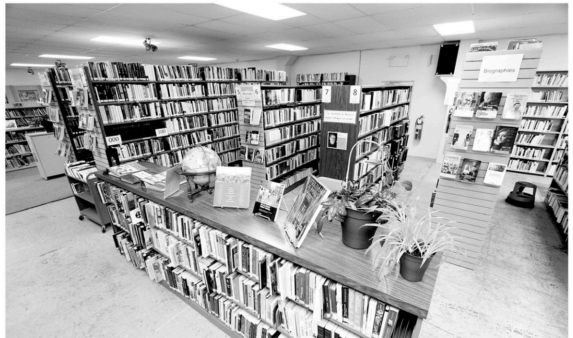
La Bibliothèque commémorative Desautels, située au sous-sol de l'église Saint-Nom-de-Marie.