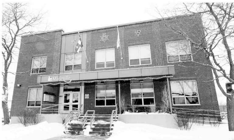
L'hôtel de ville de Marieville.

Pour remédier à la situation, la Ville entend offrir à sa population une toute nouvelle piscine