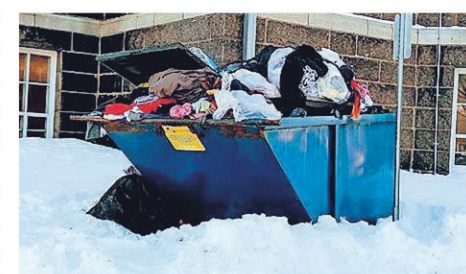
Cette image a provoqué un tollé sur les réseaux sociaux.

Cette situation désolante s'ajoute au problème vécu avec la récolte des ordures ménagères pendant le temps des Fêtes, indique une autre bénévole. « À Noël et au Jour de l'An, il y a eu des changements au niveau des dates du passage des camions pour la collecte des ordures à Louiseville. Ça fait en sorte qu'on a accumulé des vidanges supplémentaires. Il faut aussi savoir qu'il y a des ordures gelées dans le fond du conteneur et que des gens viennent porter leurs propres déchets dans notre bac.