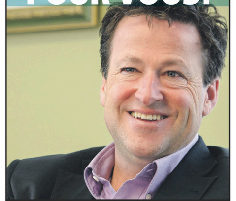
DONALD MARTEL Député de Nicolet-Bécancour