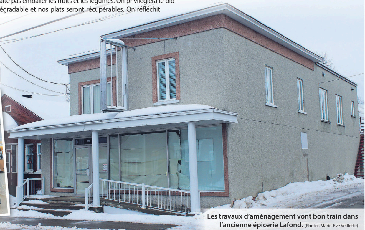
Les travaux d'aménagement vont bon train dans l'ancienne épicerie Lafond.