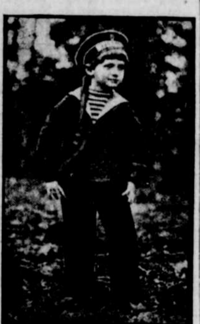
LE GRAND-DUC ALEXIS qui vient d'être proclamé empereur de Russie. Son gouvernement désavoue le traité russo-allemand de Brest-Litovsk