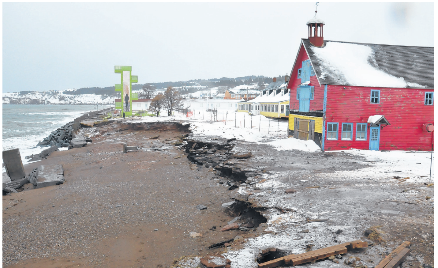
Une vaste portion d'environ 30 mètres a été arrachée.

En fin d'année, des citoyens et des infrastructures de Percé, du Grand Gaspé, de