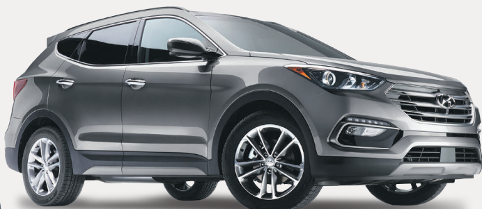
Modèle Ultimate montré*

Venez rencontrer notre équipe qualifiée et dévouée.