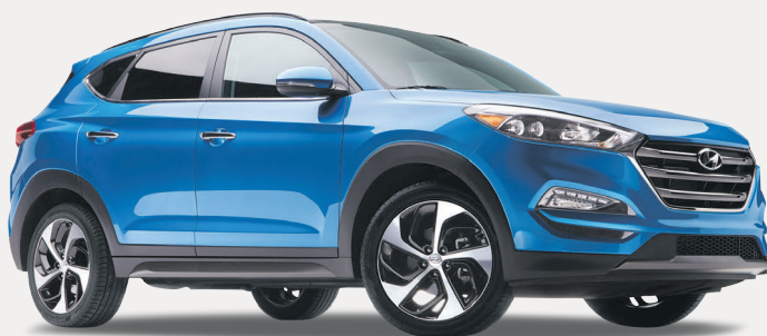
Modèle Ultimate montré*