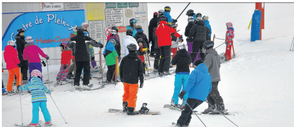
Un très beau terrain de jeux qu'est la Gaspésie en hiver.