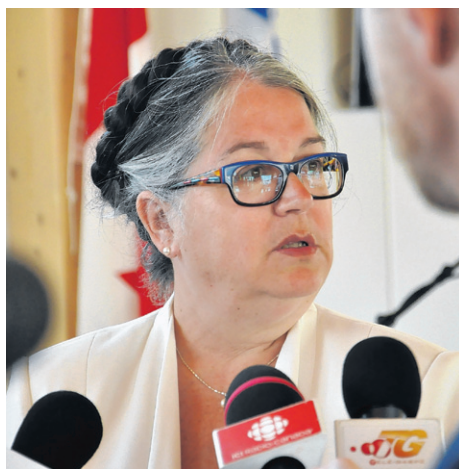
La ministre du Revenu national, Diane Lebouthillier.

De son côté, Diane Lebouthillier a été épargnée par ce rebrassage des cartes et conserve la tête du Revenu national. L'élue gaspésienne continuera donc à siéger à la table des ministres et conservera une place de choix dans l'appareil gouvernemental canadien auprès du premier ministre Justin Trudeau; une voix qui ne pourra probablement pas faire de tort pour les intérêts de la région.