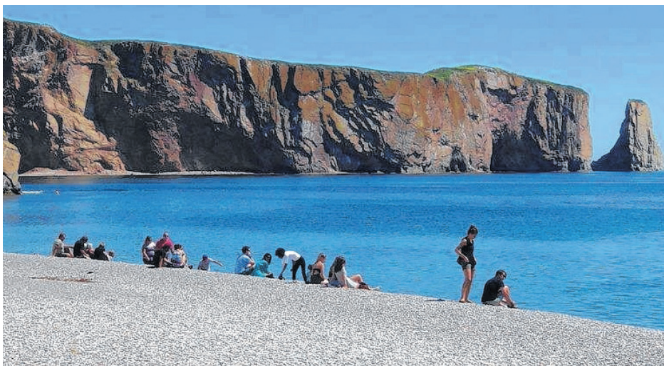
Une très belle initiative de la part du Festival pour impliquer davantage les citoyens et citoyennes du grand Percé.