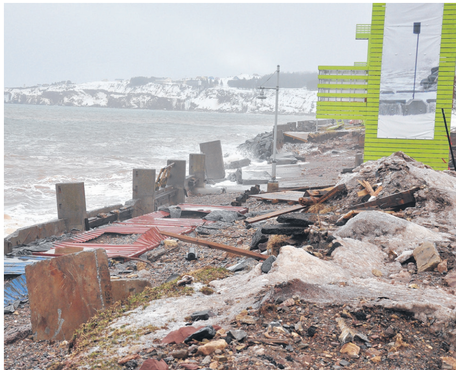
Les grandes marées ont été dévastatrices pour la promenade et le quai de Percé.