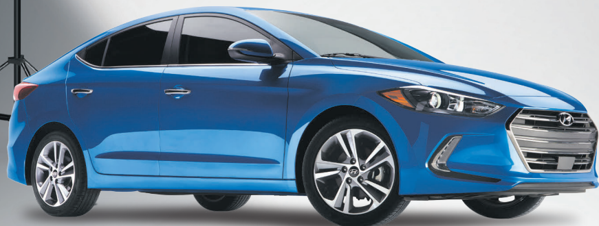
Modèle Ultimate montré*