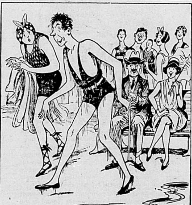
MAIS DÈS LE PREMIER BAIN, TU SORS DE L'EAU À PEU PRÈS COMME CECI ET TU EXÉCUTES UNE RENTRÉE PEU GLORIEUSE SOUS LES REGARDS AMUSÉS.