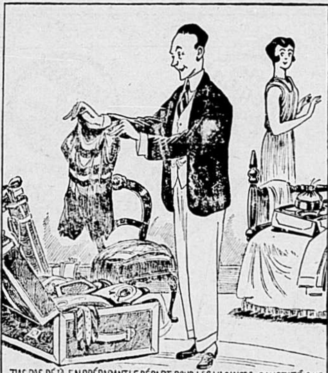
T'AS PAS DÉJÀ EN PRÉPARANT LE DÉPART POUR LES VACANCES, CONSTATÉ QUE TU AVAIS GRAND BESOIN D'UN NOUVEAU COSTUME DE BAIN—