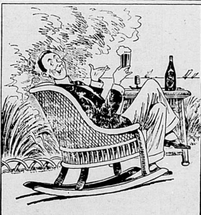
T'AS PAS DÉJÀ ESSAYÉ UNE BLACK HORSE? C'EST UN MERVEILLEUX ANTIDOTE CONTRE L'HILARITÉ DES AUTRES BAINEURS