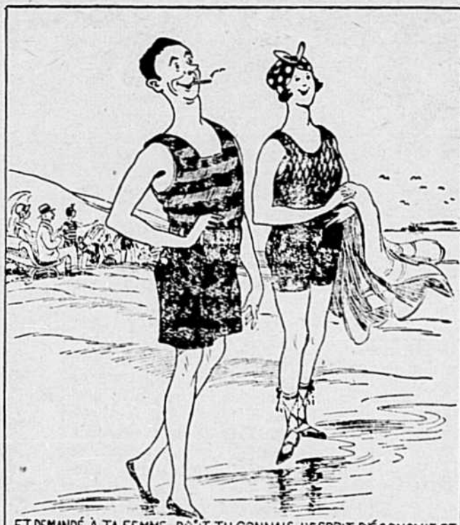
ET DEMANDÉ À TA FEMME, DONT TU CONNAIS L'ESPRIT D'ÉCONOMIE ET LE FLAIR POUR LES OCCASIONS, DE TE PROCURER QUELQUE CHOSE QUI SAURAIT AVANTAGER TA TAILLE—