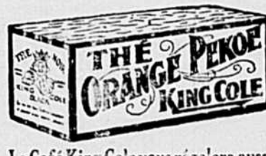
Le Café King Cole vous réglera aussi

Si l nous faut juger par les ventes considérables qui se font, la majeure partie des gens de l'Est du Canada semblent préférer le King Cole. Aux amateurs du King Cole nous adressons ce message: Essayez un livre d'Orange Pekoe King Cole. Il se vend un peu plus cher parce qu'il nous coûte beaucoup plus cher. Il nous coûte plus cher parce que nous ne nous servons que des jeunes et tendres feuilles du théier et aussi parce que nous mélangeons l'odoriférant Darjeeling des Himalayas et le dispendieux Travancore cueilli quand les vents chauds soufflent sur les montagnes des Ludes du Sud. Vous serez vifs à reconnaître la richesse suprême et la saveur du Thé Orange Pekoe King Cole. Il coûte plus cher — il vaut plus.