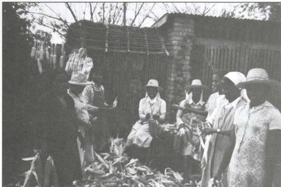
C'est au niveau du quotidien, dans la pratique communautaire et le respect de l'autre comme différent que l'on peut développer une éthique qui fasse le contrepoids au « rêve éveillé ».

Il se pourrait d'ailleurs que les chemins d'un renouveau politique aujourd'hui croisent ceux de la « spiritualité », au sens moral des motivations premières et des principes de vie. L'action a besoin d'évidence ; elle se nourrit d'espérance. Le rationalisme de la communication évacue les ambiguïtés des idéologies. Mais l'engagement pour cause de solidarité peut-il se vivre autrement qu'à travers des ambiguïtés ? Dans son Plai-