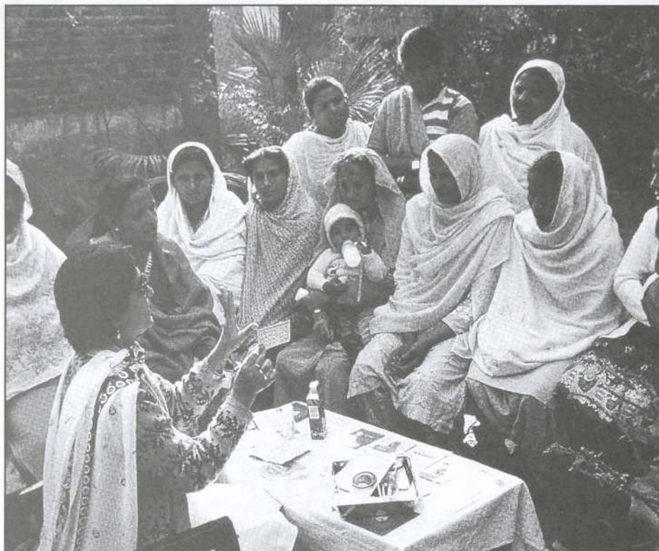
Tiré de la revue Le Courrier de l'UNESCO , janvier 1992

L'effort de « contrôle des naissances » (ici au Pakistan) peut-il être une dimension essentielle de la protection de l'environnement ? Serait-ce encore le Nord qui s'impose au Sud ?