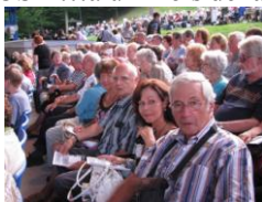
L'ARJBM sur place

« L'orchestre entier sonnait avec une clarté et richesse inouïes » écrivait le critique Claude Gingras. (La Presse, 7 août 2011- « L'OSM... à un mois de la nouvelle salle »).