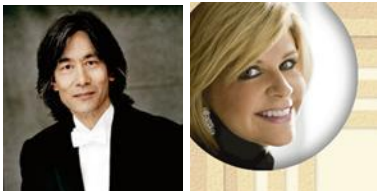
Kent Nagano et Susan Graham

La suite du programme avec Gustav Mahler (1860-1911) interprété par l'élégante mezzo-soprano américaine, Susan Graham