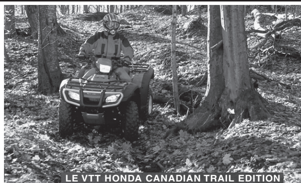
LE VTT HONDA CANADIAN TRAIL EDITION