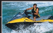
Motomarine Sea-Doo MD

BOMBARDIER EST LE FIER CONSTRUCTEUR DES PRODUITS SUIVANTS: