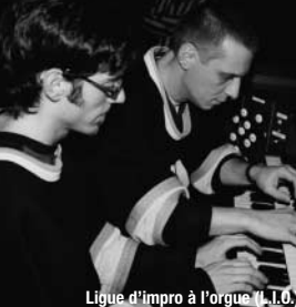
Ligue d'impro à l'orgue (L.I.O.)