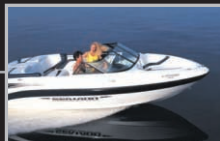
Bateau Sea-Doo MD