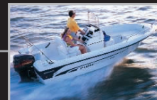
Moteurs hors-bord Johnson MD et Evinrude MD