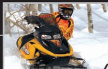
Motoneige Ski-Doo MD