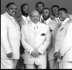
The Victory Travelers, Gospel Choir