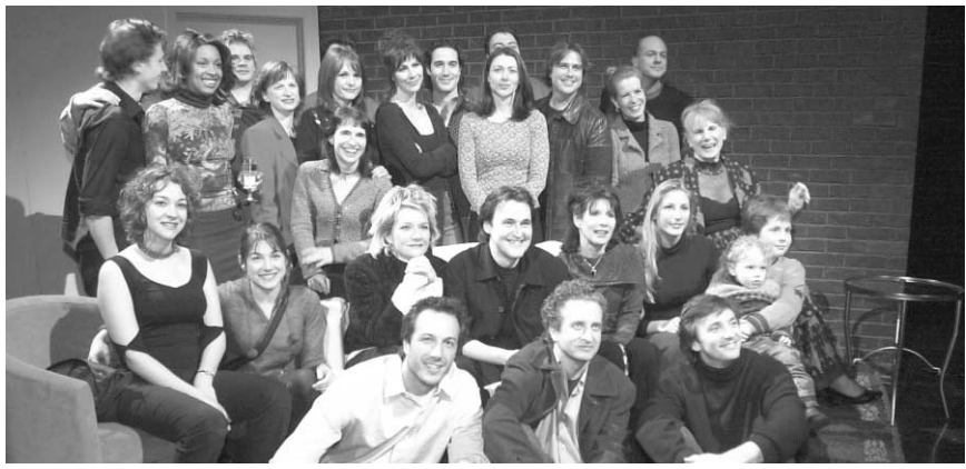
Les comédiens de l'émission Un gars, une fille assistent au visionnement de la centième émission.