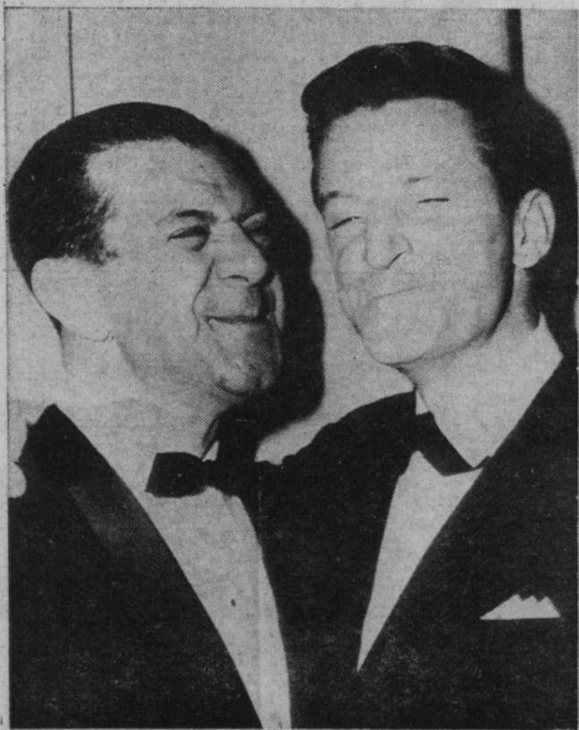
Lors du Gala du Music-Hall Canadien, vendredi dernier, OLIVIER GUIMOND a été nommé "la personnalité de l'année", chez les hommes. En Jean Lapointe, des Jérolas, il trouve ici un imitateur étonnant! (Reportage en pages centrales.)