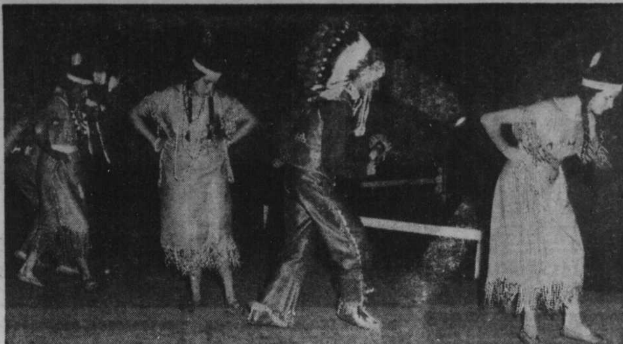
Quelques danseurs à l'entrée de la Danse du Serpent, une des danses les plus captivantes.

La gagnante de la cagnotte du programme de ROCH PROU, "De fil en aiguille", était dans la salle de délivrance, lorsque son nom a été tiré au sort, pour l'attribution de $500.