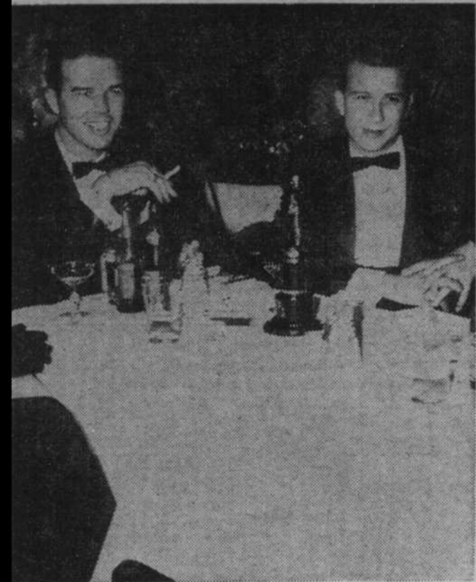
escorte et deux des "Arvacks".