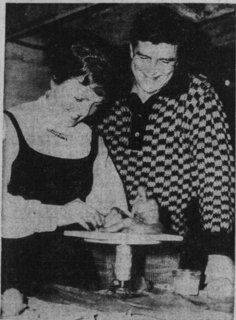
S'amuser en travaillant

DIRECTEUR DE PRODUCTION, Case Postale 277, Trois-Rivières, Qué.