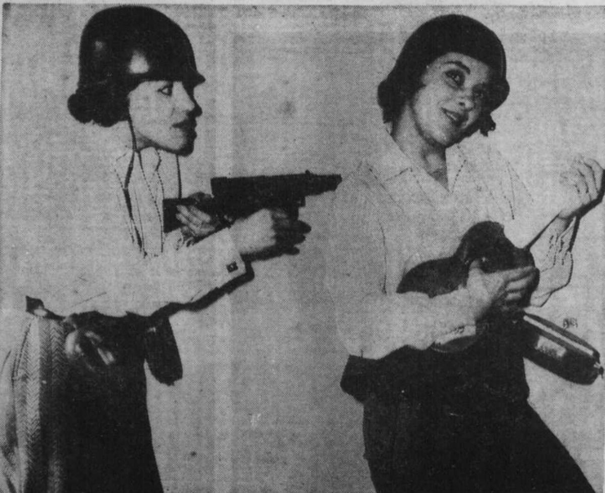
Les voilà lancées dans une ébouriffante chanson, "Carabine", sans doute l'une des faces de leur dernier disque.