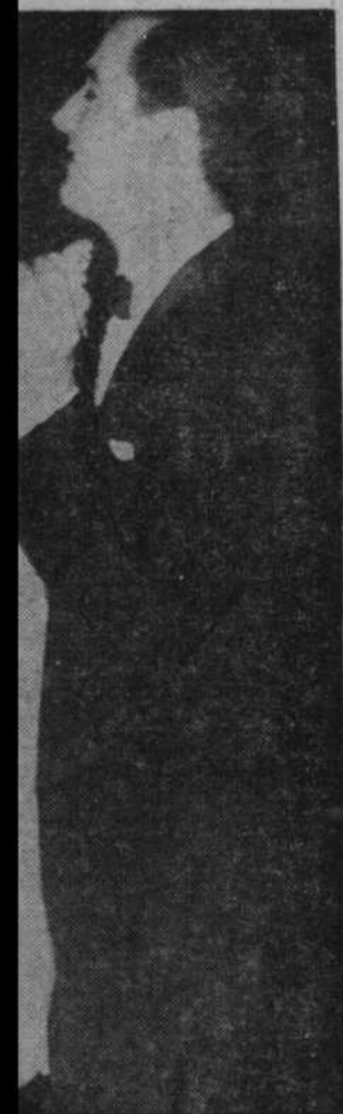
qui fait danser la "petite" Michel.

Le meilleur groupe de chanteurs: LES ARVACKS.