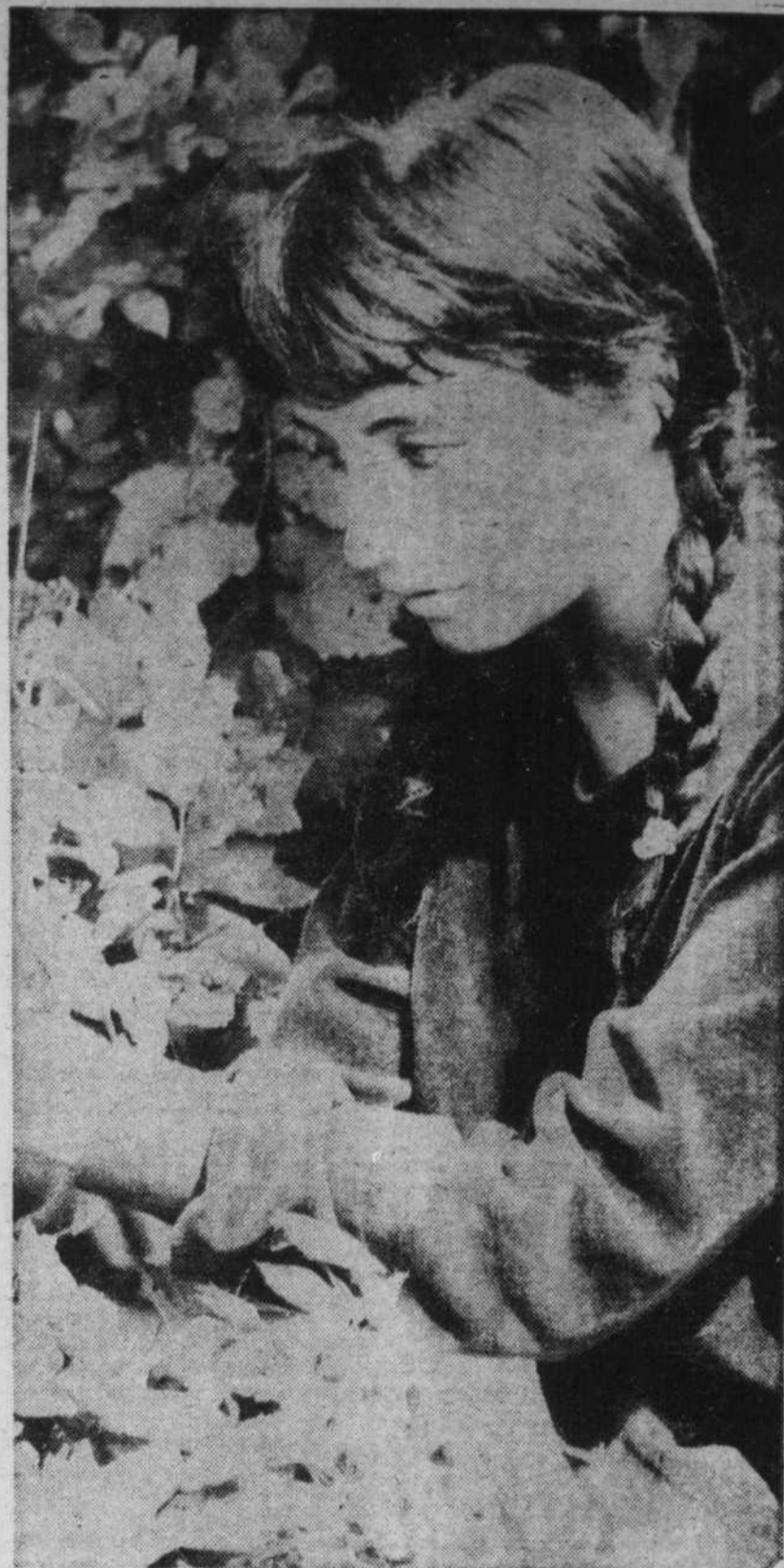
"Je me sens très près de la nature," dit-elle.

Vous voyez bien qu'elle aurait du talent.