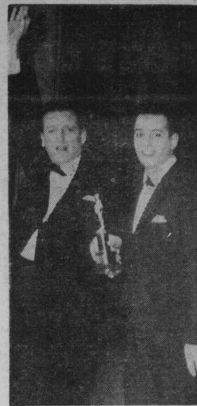
Les Jérolas: enfin un trophée. Bravo!