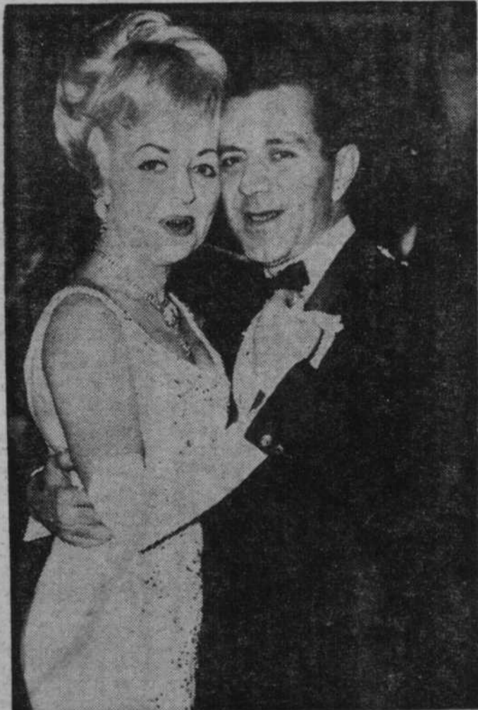
Olivier Guimond, (Tizoune) un des héros... "J'ai pas Muriel moi!"