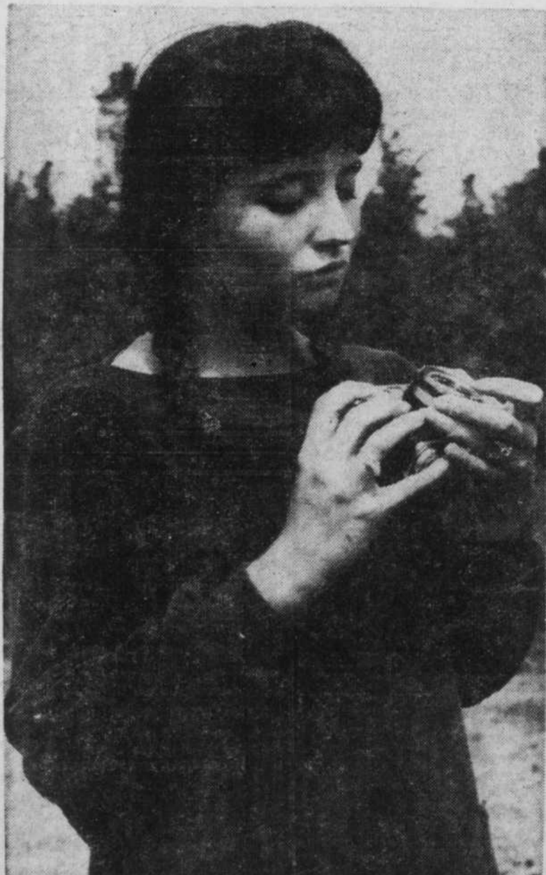
Un intérêt marqué pour la photographie