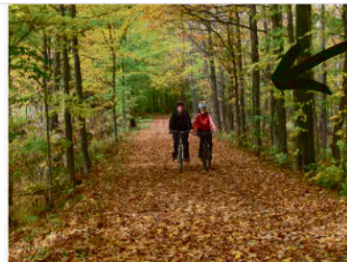
Sentier de l'Ardoise