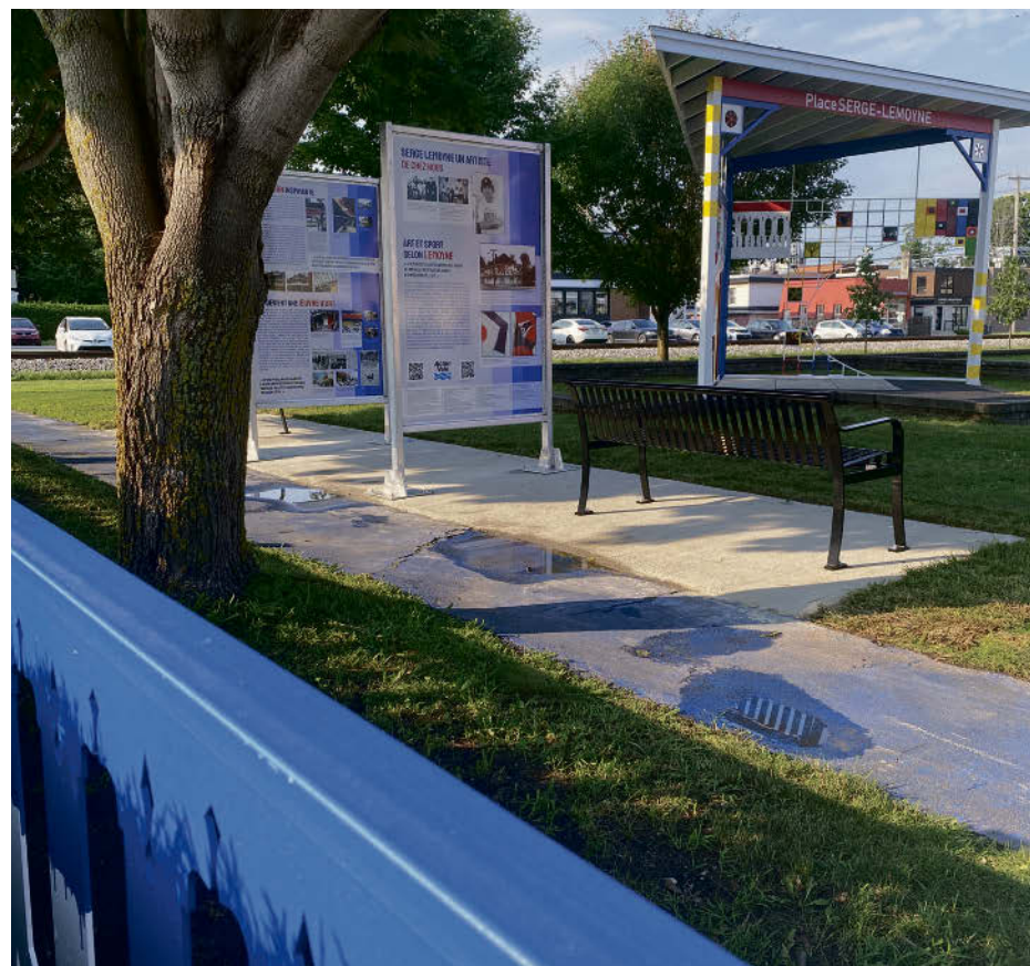
Les différentes installations de la place Serge-Lemoyne ont été rénovées par les artistes au mois de juin.

Plusieurs activités s'ajouteront à la programmation tout au long de l'année. L'équipe derrière le projet invite les citoyens à consulter les sites Internet de la MRC d'Acton et de la Ville d'Acton Vale ainsi que la page Facebook dédiée à cet effet.