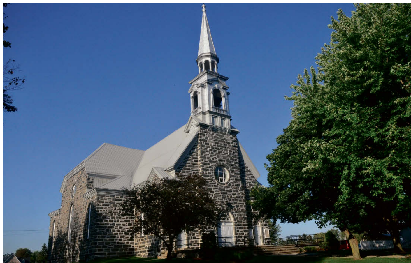
La restauration de l'église fait partie du plan d'action 2023-2025 déposé par la Municipalité de Saint-Nazaire-d'Acton.

La troisième a pour but d'améliorer l'indice de vitalité économique par l'accroissement des revenus fonciers et le développe-